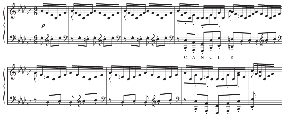
Exemple 3 : Olivier Greif, Sonate n°21 « Codex domini », m. 17-25.