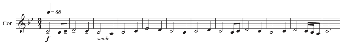
Exemple 8 : Olivier Greif, Ritournelle , « Præludium », Mélodie de cor.

vers le sixième degré avant de revenir à la tonique. Ceci évoque la fameuse cadence Landini, fréquente de la fin du XIV e siècle au début du XV e siècle. Ici l'inspiration populaire voisine avec les subtilités de l' Ars nova :