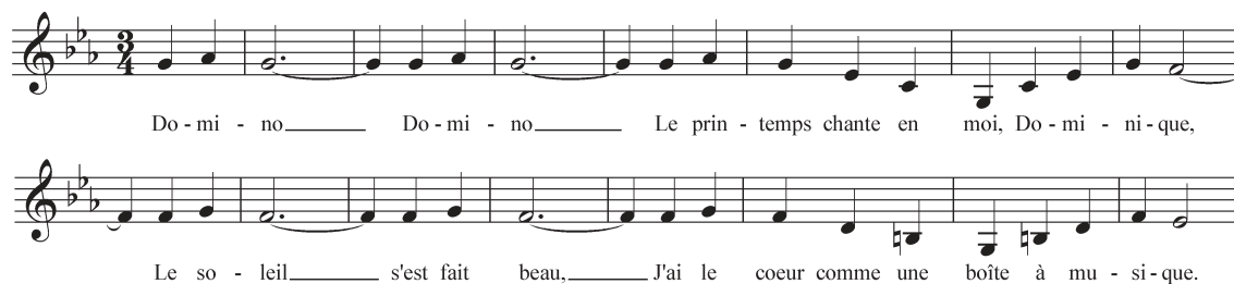
Exemple 2 : Domino , première partie du refrain.

La musique de ses dernières années porte encore la trace des fredons de son enfance. La Sonate n° 21 « Codex Domini » pour piano (1994) est conçue autour d'une « citation de la chanson des années 1950, Domino d'André Claveau. Avec ses rappels à trois octaves dans le grave, elle se transforme en une valse triste et bancale, aux accents gainsbouriens 7 . » À la mélodie empruntée se mêle un motif de basse dont les notes symbolisent le mot « CANCER » – maladie dont il était alors affecté – encodé selon l'écriture anglo-allemande : do - la - sol - do - mi - ré .