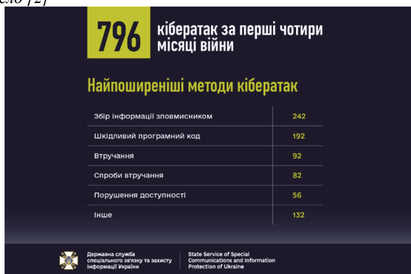
Рис. 2. Найпоширеніші методи кібератак за перші 4 місяці війни Джерело [2]

Однією з нещодавніх цілей російських хакерів було проникнення в планшети Android, які українські військові використовують для «планування і виконання бойових завдань». СБУ вважає це спробою викрадення даних, що надсилаються з мобільних пристроїв солдатів до супутникової системи Starlink. [7]