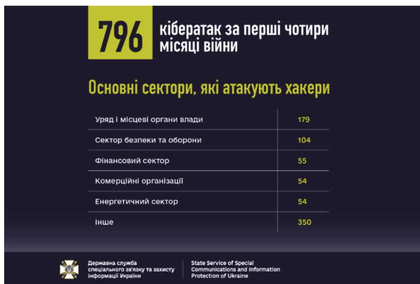
Рис. 1. Основні сектори кібератак за перші 4 місяці війни Джерело [2]

зв'язку: за перші 4 місяці війни було виконано близько 800 кібератак, найчастіше спрямованих на Уряд й місцеві влади з метою збору інформації. [2]