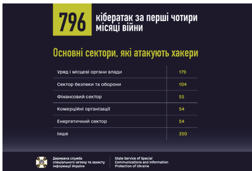
Рис. 1. Основні сектори кібератак за перші 4 місяці війни

зв'язку: за перші 4 місяці війни було виконано близько 800 кібератак, найчастіше спрямованих на Уряд й місцеві влади з метою збору інформації. [2]