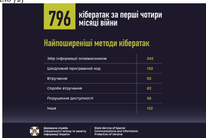
Рис. 2. Найпоширеніші методи кібератак за перші 4 місяці війни

Однією з нещодавніх цілей російських хакерів було проникнення в планшети Android, які українські військові використовують для «планування і виконання бойових завдань». СБУ вважає це спробою викрадення даних, що надсилаються з мобільних пристроїв солдатів до супутникової системи Starlink. [7]