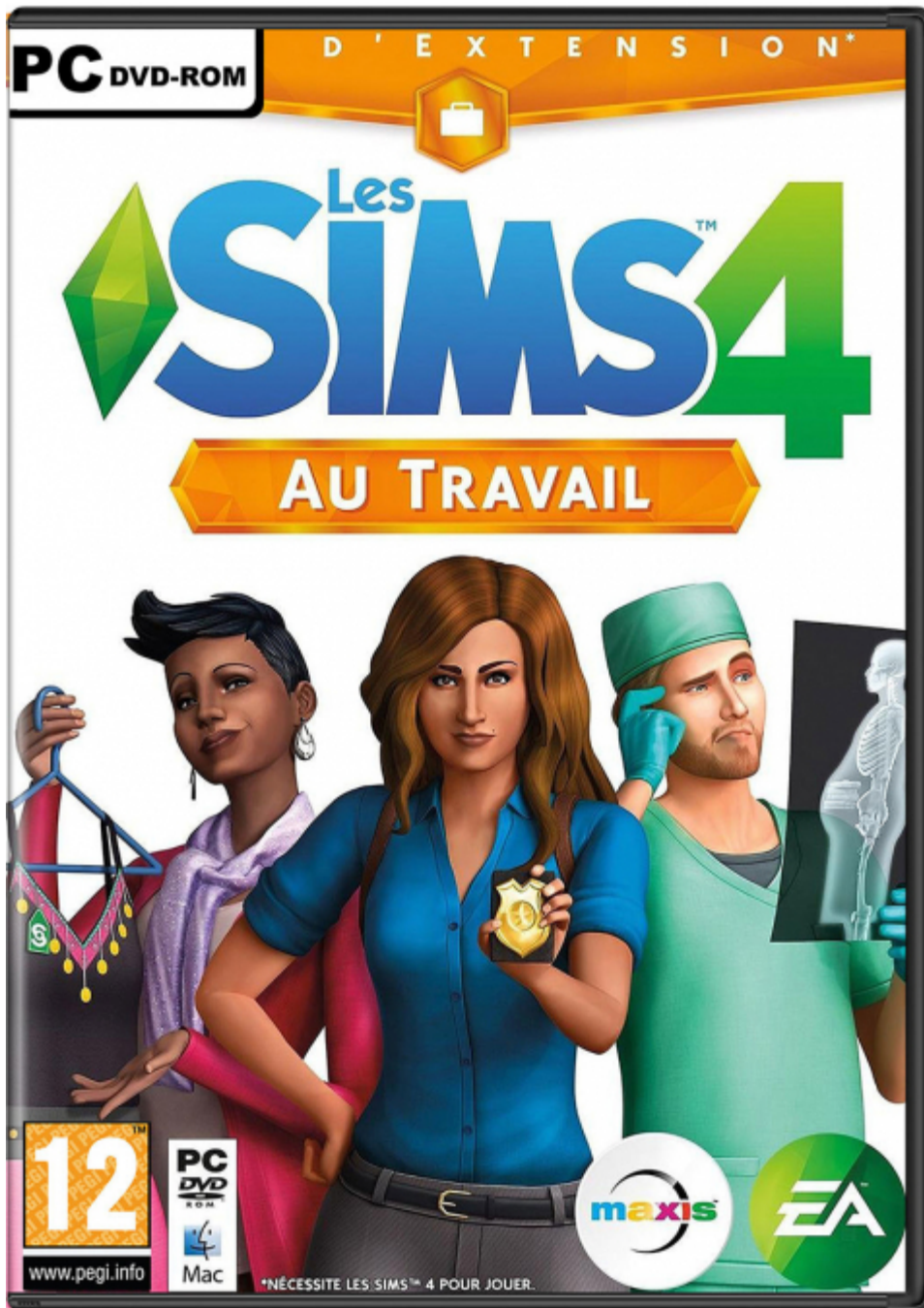
Jaquette du disque additionnel