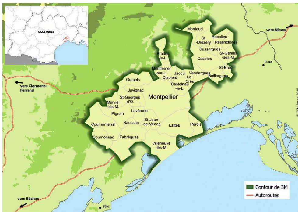
Figure 2 : Les 31 communes de Montpellier Méditerranée Métropole, in Insee Analyses n° 65, décembre 2018.