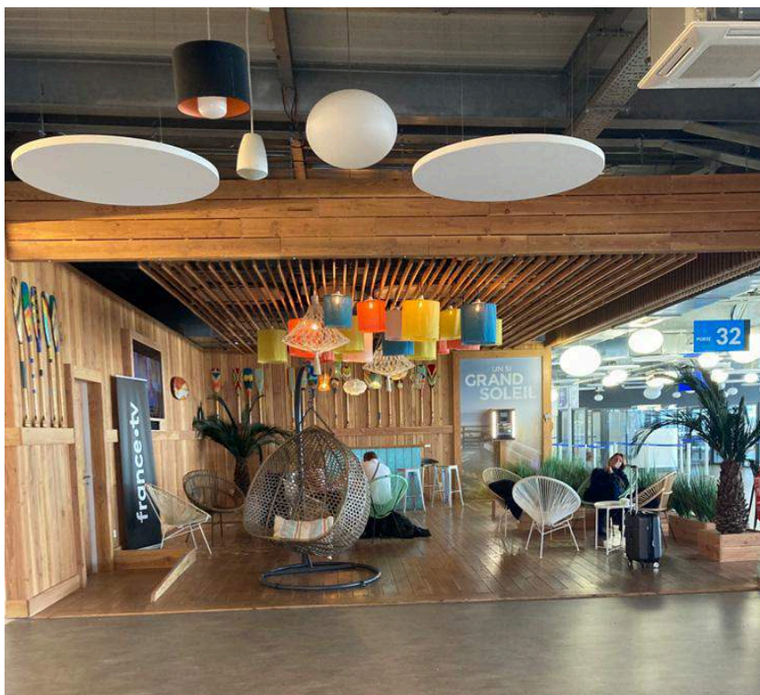
Figure 4 : showroom représentant un des décors de la série, la Paillotte, dans l'aéroport Montpellier-Méditerranée (photographie : auteur-e, 2023)