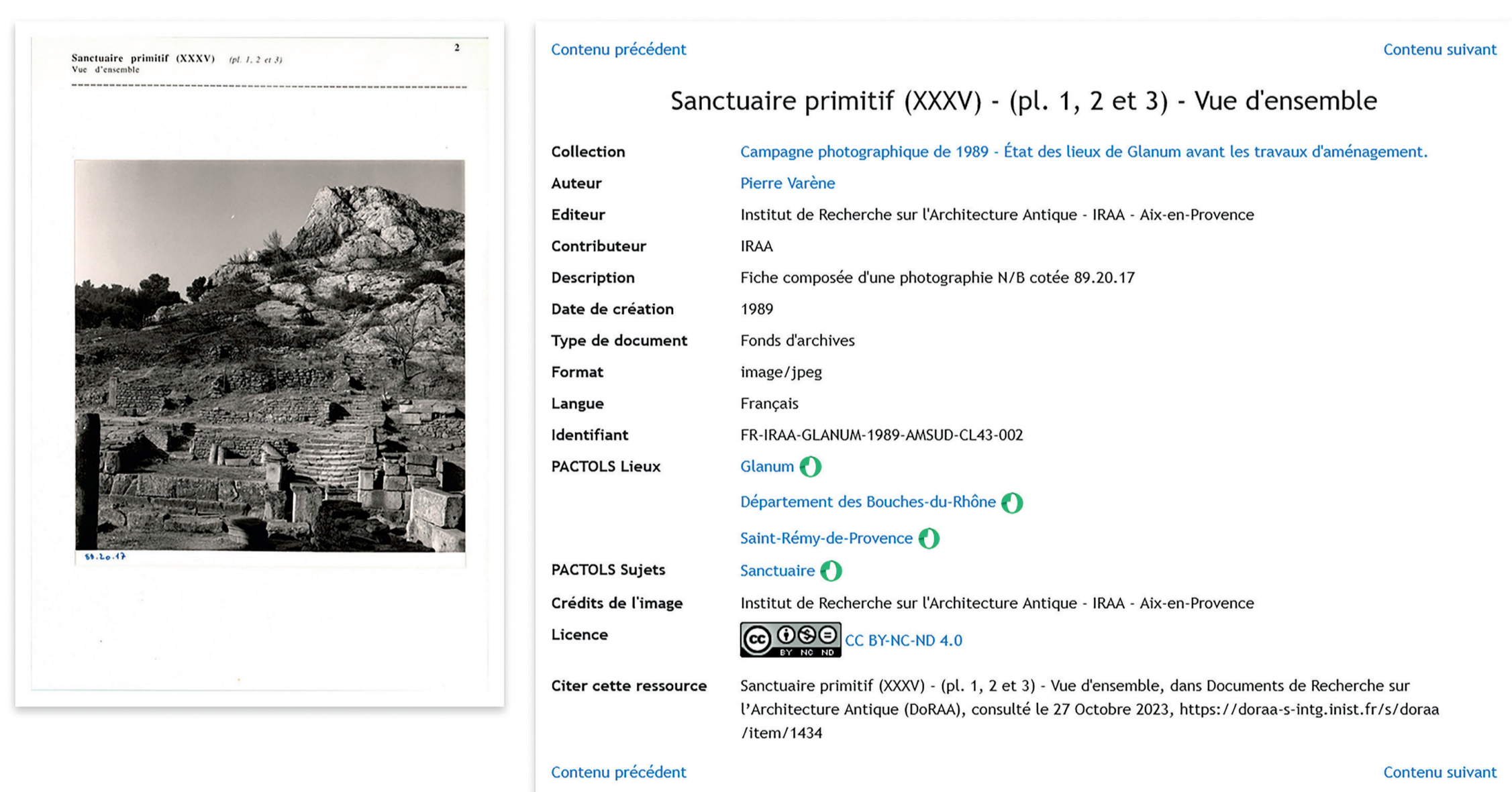
Fig. 3 : Exemple d'une fiche photographique de 1989 avec la légende d'origine et accompagnée de ses métadonnées - Campagne photographique dirigée par Pierre Varène avant les travaux d'aménagement du site archéologique pour l'ouverture au public. Copie d'écran de DoRAA.

Première mission de l'archiviste : recontextualiser les documents pour éclaircir les conditions et les moyens techniques de l'époque de leur production. Dans le cadre de la Science Ouverte, documenter les données anciennes impose l'utilisation de techniques numériques. Les principes FAIR donnent un cadre de traitement des documents. Le schéma de métadonnées Dublin Core, le thésaurus PACTOLS (vocabulaire contrôlé) et la licence CC offrent la possibilité de créer des contenus accessibles à un large public. L'archive numérique DoRAA joue ainsi un rôle important dans la diffusion de la connaissance du métier d'architecte-archéologue spécialiste des monuments antiques et montre la place de l'analyse architecturale dans les études d'archéologie.