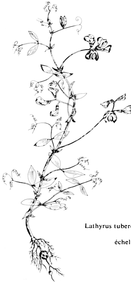
Lathyrus tuberosus L.