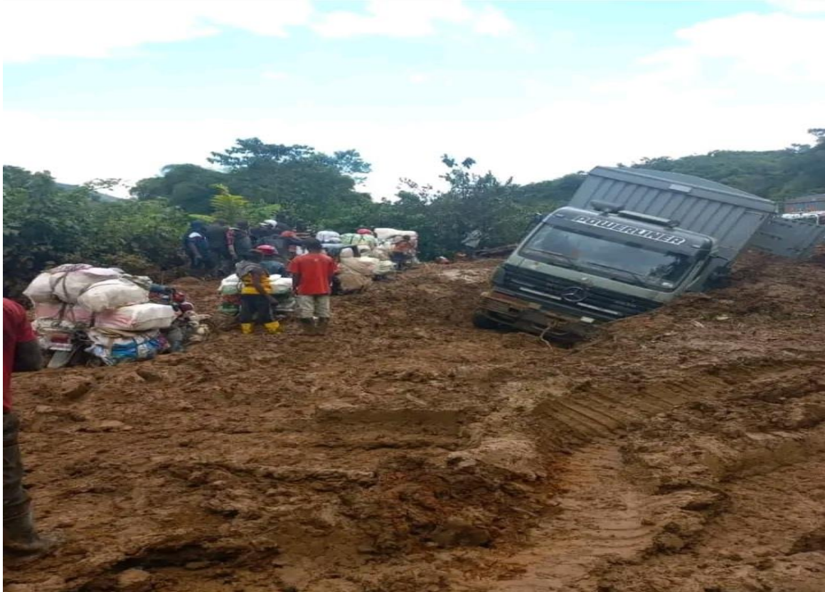
Image 2: Route reliant le territoire de Shabunda à la ville de Bukavu

Les infrastructures jouent un rôle important pour le développement. Des systèmes de transport aux installations de production d'énergie, en passant par les réseaux d'alimentation en eau et d'assainissement, les services qui permettent à la société de fonctionner et à l'économie de prospérer sont fournis grâce aux infrastructures. C'est pourquoi elles sont au cœur des efforts pour réaliser les objectifs de développement durable. Alors avec l'insuffisance des infrastructures ou leur absence au pays on maintient ce dernier sans le savoir et sans le vouloir dans le sous-développement. Qu'il s'agisse de santé et d'éducation, ou encore d'accès à l'énergie, à l'eau potable et à l'hygiène, la plupart des objectifs de développement durable vont nécessiter des améliorations dans le domaine des infrastructures.