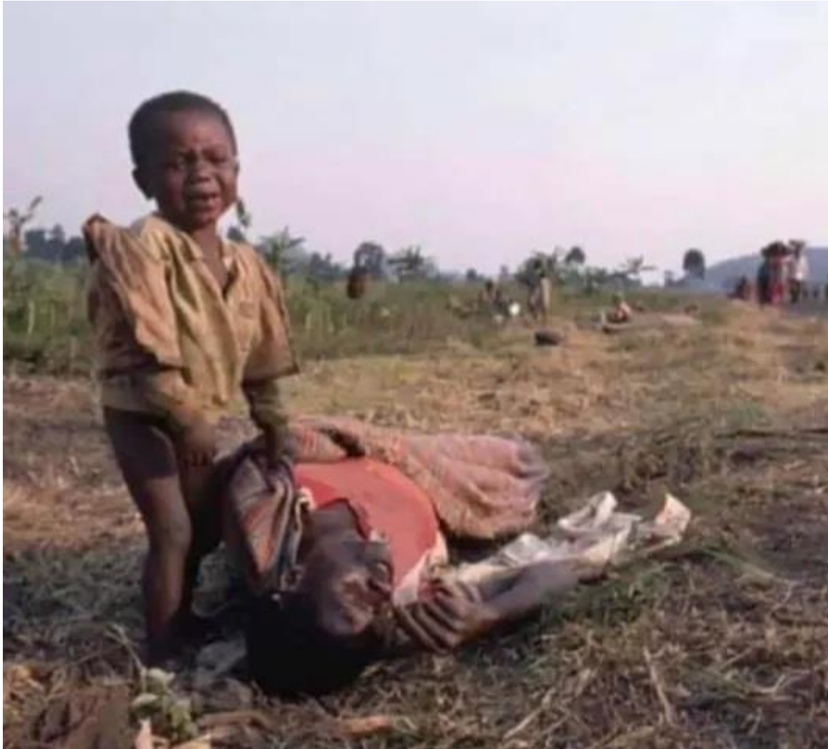
Image 1 : Photo d'une petite fille du Kivu qui pleure pour sa mère tuée par le M23

La guerre comme la mauvaise gouvernance sont des véritables facteurs du sous-développement d'un pays. Sans la paix on ne peut songer au développement du pays quoiqu'il en soit. D'un sac de braises on ne peut pas s'imaginer y avoir un petit verre de farine blanche: lorsqu'il y a la guerre dans un pays on doit complètement oublier le développement car pendant la guerre il n'y a aucune activité économique qui peut exister sur le territoire en guerre même si la population y