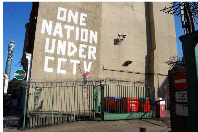
Banksy, One Nation Under CCTV , Londres, 2008, © de l'artiste.

sant, dont le voyeurisme potentiel se retrouve associé à celui de la caméra. Cette méta-perturbation textuelle rend indirectement visible la présence de la caméra et dévoile les motivations de notre société de contrôle, braquée en continu sur des innocents en sursis. Banksy précise à ce propos qu'il déteste quand les gens disent que : « si on n'a rien fait de mal, alors on n'a rien à cacher. On a tous quelque chose à cacher, ou alors c'est qu'on a vraiment un problème 1 ».