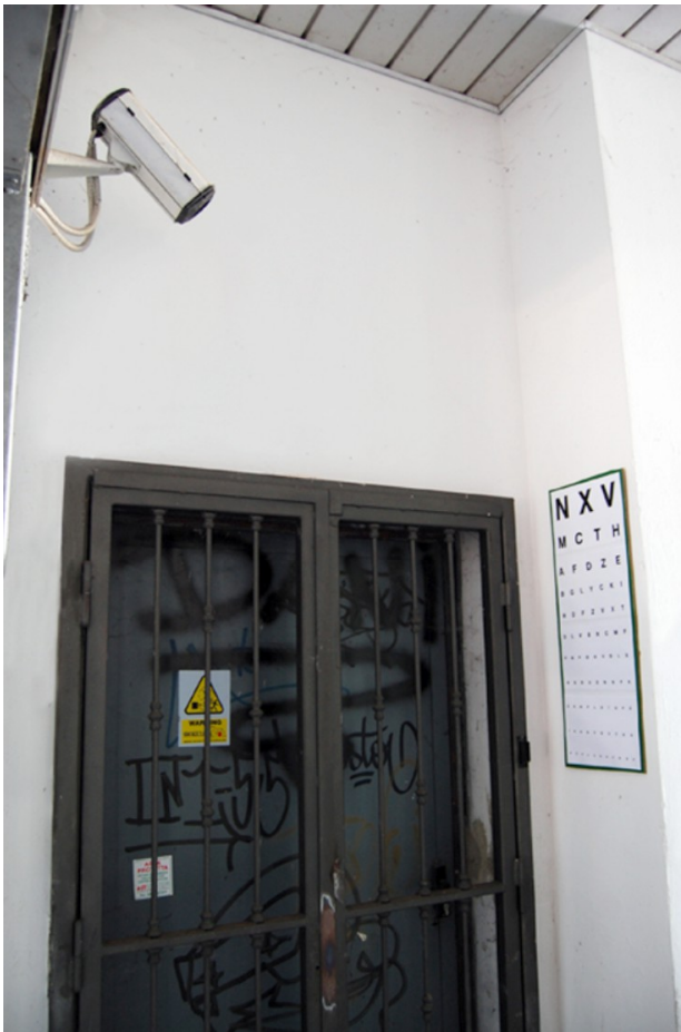
Fra Biancoshock, Control the controllers , Milan, 2012, photographie Myst-R © Fra.Biancoshock.

l'espace urbain. À travers ce texte épuré et maîtrisé dans sa forme, Mobstr incite le regard à suivre le prolongement de la flèche pour dévoiler explicitement la vraie perturbation urbaine incarnée par la caméra. Instigateur d'un méta-contrôle artiste, il perturbe textuellement la neutralité apparente de l'espace urbain. La forme pronomiale du texte est ici utilisée pour dénoncer les dérives potentielles d'un regard numérique liberticide que nous ne sommes pas toujours en mesure de repérer directement.