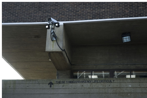
Mobstr, Surveillance , Newcastle, 2009.

à ce sentiment d'omniscience invisible. Le glissement imperceptible du texte mis en scène dans cette fresque ambiguë semble vouloir alerter les citoyens actuels sur d'éventuelles mutations comportementales. Ces dernières pourraient en effet se développer insidieusement face aux attentes d'une société sécuritaire réactivant l'omniscience invisible du panoptique par le biais de ses caméras de surveillance.