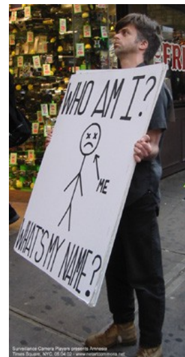
Surveillance Camera Players, Amnesia , Times Square, New-York, 2004, © Surveillance Camera Players.

À l'instar de Banksy, Mobstr ou Fra Biancoshock, les perturbations textuelles des Surveillance Camera Players créent une ambivalence sur la pluralité de leur destinataire : leur message s'adresse de fait à la caméra de surveillance tout en recueillant l'attention des passants. Certains d'entre eux prennent le temps de s'arrêter ou de photographier la « scène » avant de lever les yeux vers le dispositif de contrôle. Bill Brown