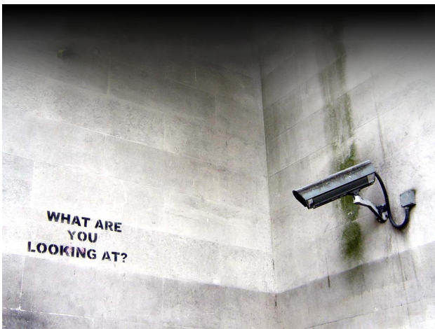
Banksy, What are you looking at ? , Marble Arch, Londres, 2004, © de l'artiste.

Dans cette mouvance contestataire, le street-artiste britannique Banksy, originaire de Bristol, intervient de façon anonyme et illégale depuis la fin des années 2000 en dénonçant notre mise sous surveillance généralisée. En 2004, il a peint la phrase « WHAT ARE YOU LOOKING AT? – Qu'est ce que tu regardes ? », au pochoir et en lettres majuscules, dans le champ d'une véritable caméra de surveillance installée sur un mur londonien du quartier de Marble Arch.