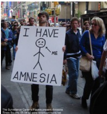
Surveillance Camera Players, Amnesia, Times Square, New-York, 2004