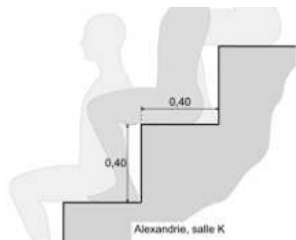
Profil des gradins de la salle F d'Alexandrie, avec disposition alternée des auditeurs Dessin de Rémi Godderis.