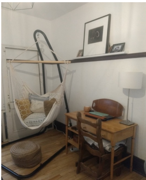
Figure 6.2. Le hamac dans le bureau d'Audrey (#6).

« Ça me rappelle que j'ai fait le choix, puis je me rappelle les avantages de ce type d'emploi là (...) Des fois c'est plus difficile, c'est moins jovial...mais j'ai fait le choix de profiter d'être dans mon hamac quand j'ai besoin de pause » (Audrey #6)