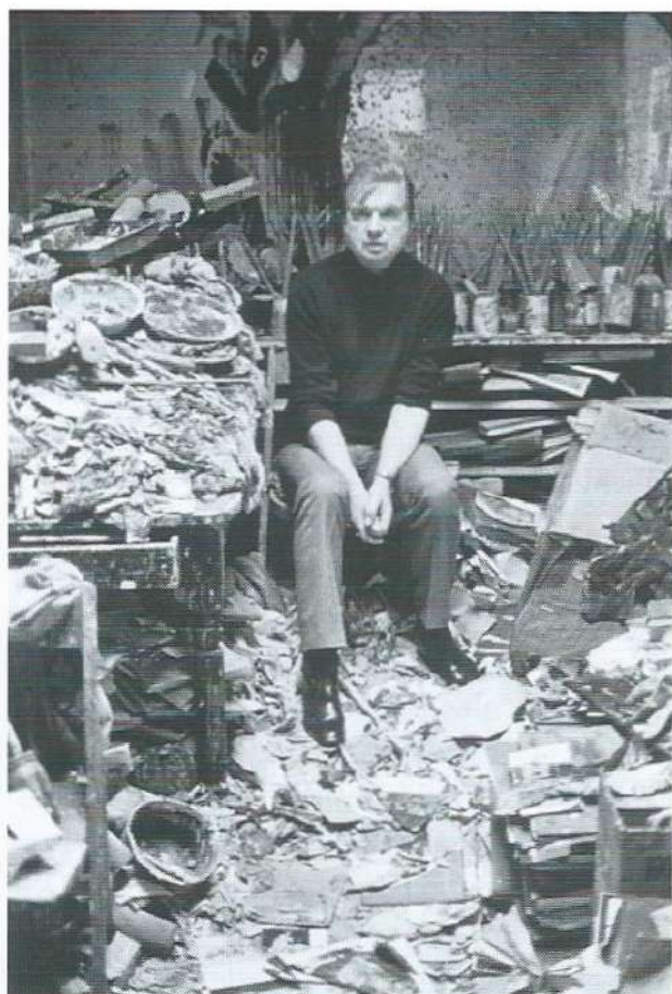
Au 7 Reece Mews en 1977. Francis Bacon s'installe en 1961 dans cet atelier du quartier de South Kensington à Londres. Celui-ci sera à la fois son lieu de travail et de vie.

de peindre. Ce travail préparatoire peut passer par des esquisses, mais pas nécessairement, et même les esquisses ne le remplacent pas (Bacon, comme beaucoup de peintres contemporains, ne fait pas d'esquisse). Ce travail préparatoire est invisible et silencieux, pourtant très intense. Si bien que l'acte de peindre surgit comme un après-coup (« hystérésis ») par rapport à ce travail » 15 .