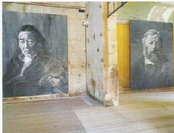
Yan Pei-Ming peignant un portrait de Gustave Courbet / Exposition Yan Pei-Ming face à Courbet à l'atelier Courbet d'Ornans (11 juin au 30 septembre 2019 au musée Courbet d'Ornans).

Cette résidence de Pei-Ming chez Courbet montre que l'art, la naissance d'une œuvre dépasse la question du temps. Ce pont entre trois siècles tisse ainsi des liens très forts entre deux artistes mais éclaire aussi les méandres de la création d'une œuvre.