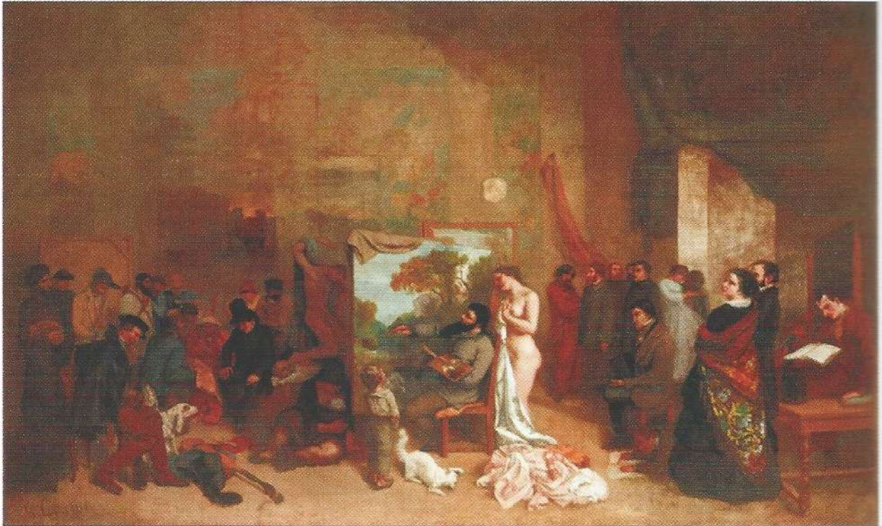
Gustave Courbet, L'Atelier du peintre, 1854-1855. Huile sur toile 361 x 598 cm. Achat avec l'aide d'une souscription publique et de la Société des Amis du Louvre, 1920