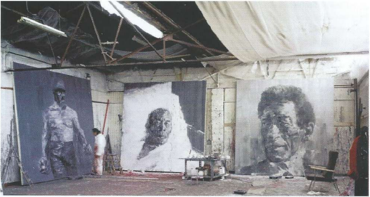
Yan Pei-Ming dans son atelier à Dijon en 2007.

L'œuvre se constitue « in progress » ; elle est issue d'une maturation, d'une gestation.