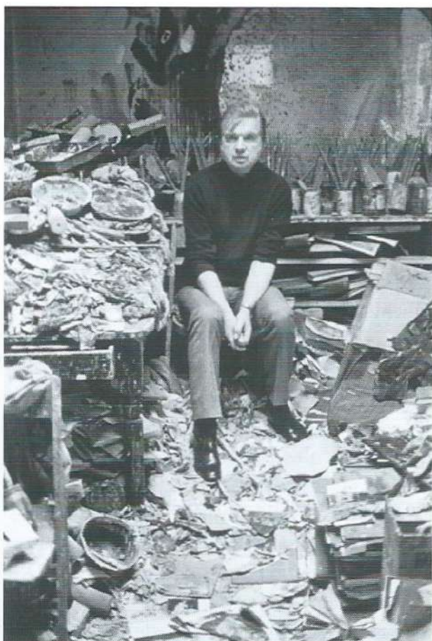
Au 7 Reece Mews en 1977. Francis Bacon s'installe en 1961 dans cet atelier du quartier de South Kensington à Londres. Celui-ci sera à la fois son lieu de travail et de vie.

de peindre. Ce travail préparatoire peut passer par des esquisses, mais pas nécessairement, et même les esquisses ne le remplacent pas (Bacon, comme beaucoup de peintres contemporains, ne fait pas d'esquisse). Ce travail préparatoire est invisible et silencieux, pourtant très intense. Si bien que l'acte de peindre surgit comme un après-coup (« hystérésis ») par rapport à ce travail » 15 .