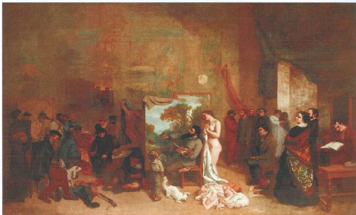
Gustave Courbet, L'Atelier du peintre, 1854-1855. Huile sur toile 361 x 598 cm. Achat avec l'aide d'une souscription publique et de la Société des Amis du Louvre, 1920