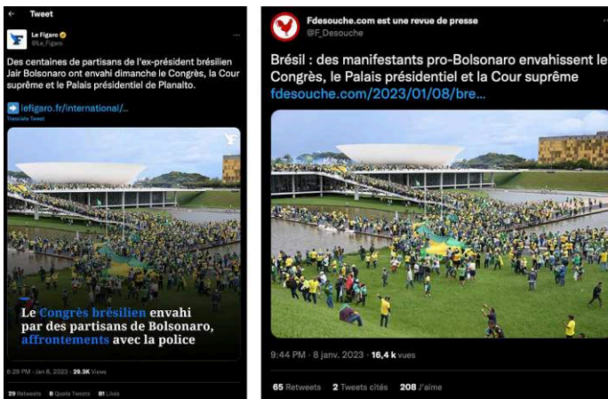
Figures 1 ( Le Figaro ) et 2 ( Fdesouche ). Captures d'écran du 8 janvier 2023

En premier lieu, nous avons observé à titre exploratoire une information d'actualité ordinaire en provenance du journal Le Figaro repris par Fdesouche sur Twitter.