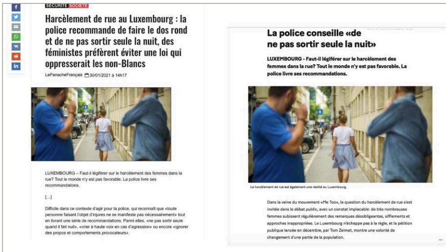
Figure 5. À gauche, l'article repris par Fdesouche , et à droite, l'article original de L'Essentiel

Cet article est à l'origine issu d'un traitement journalistique d'une information d'actualité ordinaire. En reprenant l'article, Fdesouche change le titre et découpe l'information en sélectionnant uniquement certains passages. Cette réutilisation des contenus journalistiques sans respect de l'angle journalistique ni de la mise en forme de l'information choisie par le journaliste constitue une désinformation au service d'une idéologie. De plus, lorsque l'article subtilement modifié est diffusé via les réseaux siconumériques, la distinction entre l'original et la version modifiée s'avère compliquée à détecter pour le lecteur. Dans un espace de temps limité, l'utilisateur-récepteur ne lit pas forcément l'intégralité de l'article et peut s'arrêter au titre et au chapô. La source de média, qui est mentionnée et apparente, constitue, elle aussi, un piège puisque les usagers-récepteurs peuvent s'en contenter et ne pas faire l'effort de se rendre sur le site du média pour comparer les deux contenus.