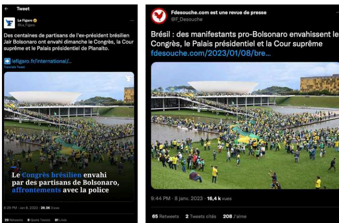
Figures 1 ( Le Figaro ) et 2 ( Fdesouche ). Captures d'écran du 8 janvier 2023

En premier lieu, nous avons observé à titre exploratoire une information d'actualité ordinaire en provenance du journal Le Figaro repris par Fdesouche sur Twitter.