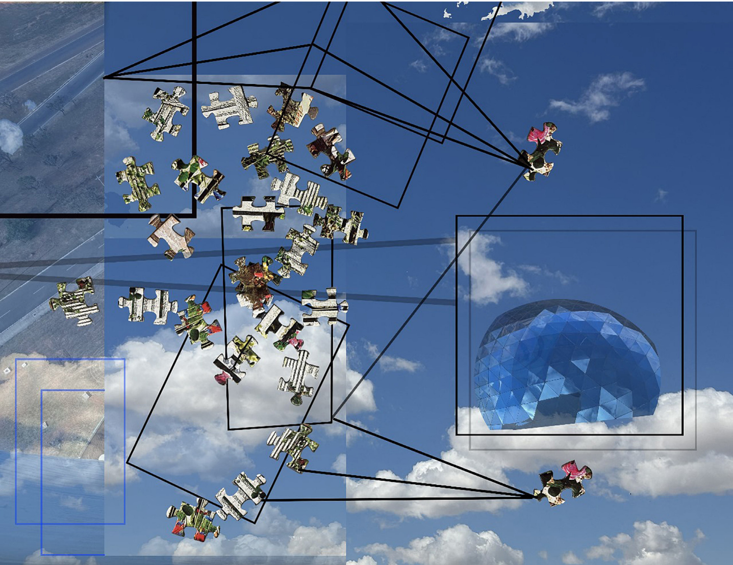
Figura 1: Série Looking for: Emergence of the dot connections, dimensão variável, imagem computacional, Nikoleta Kerinska, 2023.