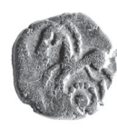
3 (1,5 : 1)