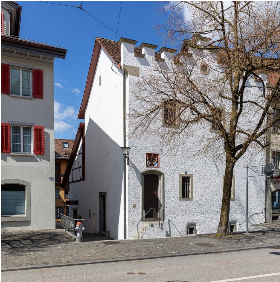
Anken-Waage Bürgerarchiv Zug

JoachimKohler-HB, CC BY-SA 4.0, via Wikimedia Commons