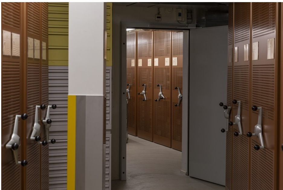
Stadtarchiv Zürich, Magazinraum

Généralement, seules les grandes communes (la plupart des chef-lieux cantonaux, Winterthour, Lugano, Bienne) ou de plus petites villes avec une riche histoire (Sursee, Stein am Rhein, Montreux, Meyrin) ont un service d'archives professionnel. Toutefois, la taille ne fait pas tout et il faut souligner qu'il existe aussi certaines grandes localités qui n'ont pas d'archivistes.