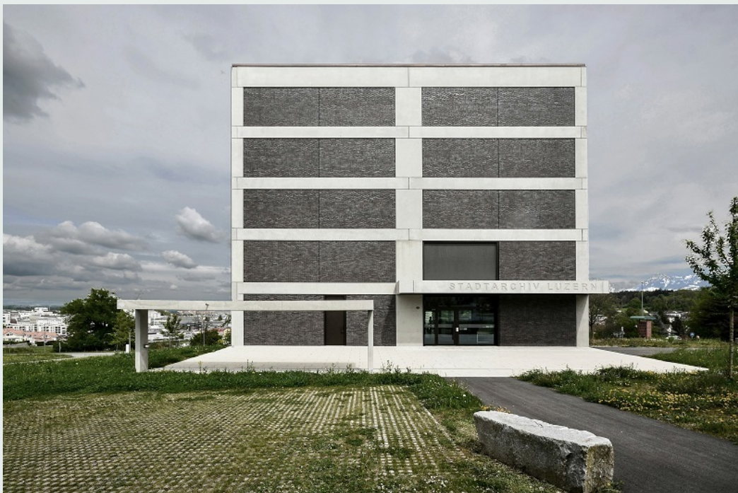
Enzmann Fischer Partner, Stadtarchiv Luzern. Foto: Rafael Baumann, 2017 (Hochschule Luzern – Technik & Architektur).

S'il est un cas qui illustre à lui seul l'imbrication de ces différentes formes de communes, c'est bien Lucerne. En 1831, la révision totale de la Constitution cantonale a introduit la division entre une commune politique, une commune bourgeoise et une corporation. Le rôle dominant de la bourgeoisie dans la Ville de Lucerne a ainsi pris fin: ses tâches se sont limitées au droit de cité, à l'assistance aux pauvres et à la tutelle. Avec l'introduction du Code civil fédéral en 1907, la responsabilité de la tutelle a été transférée à la commune politique.