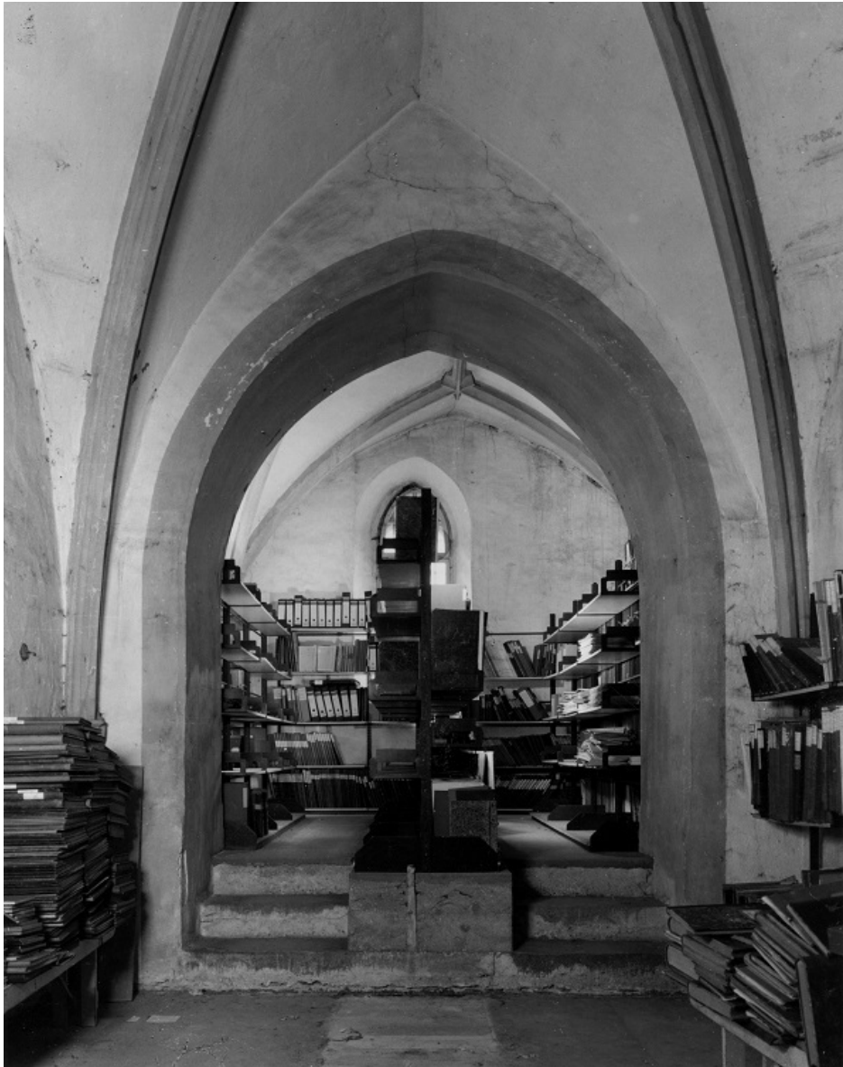
Blick in die Archivräumlichkeiten der Stadt Schaffhausen in der Sakristei der Kirche St. Johann

Difficile de dépeussier l'image des archives lorsque ces dernières continuent à être entassées dans un grenier mal isolé ou au fonds d'une cave humide et que les données de la population dans leur application métier ne sont pas perçues comme des archives!