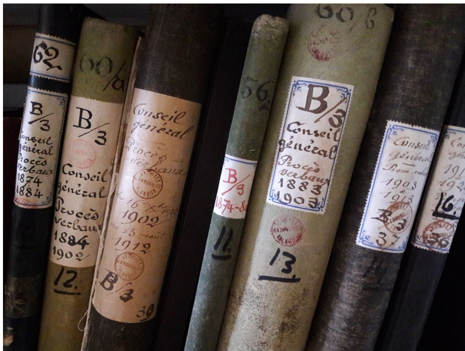
Procès-verbaux provenant des archives d'une commune fusionnée (Commune de Milvignes)

Dans certains cantons, les fusions de communes sont de plus en plus fréquentes, et ce généralement pour rationaliser les ressources communales. C'est parfois une opportunité pour traiter les fonds d'archives des anciennes communes avant la fusion et pour mettre en place un système de gestion documentaire cohérent pour l'ensemble de la nouvelle administration communale. Toutefois, lors de telles réorganisations, les archives ne figurent, la plupart du temps, pas au rang des premières priorités. Par ailleurs, elles encourent le risque que les fonds d'archives des anciennes communes restent dans les anciennes maisons communales, sans surveillance et petit à petit oubliés, voire disloqués ou détruits lors d'une nouvelle affectation du bâtiment.