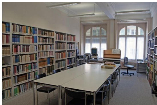
Stadtarchiv Schaffhausen: Eingang und Lesesaal 2014