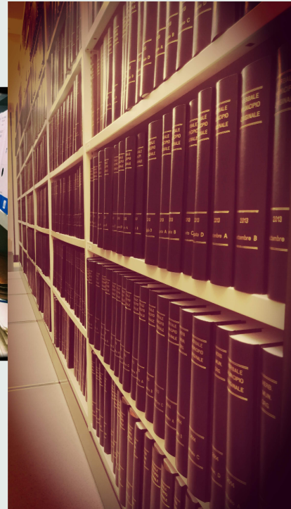
Archivio amministrativo di Lugano: verbali del Municipio di Lugano e archivio di un comune fuso con Lugano.

La nécessité d'un traitement sur le long terme de telles structures a souvent permis l'engagement pérenne ou l'externalisation d'un-e ou de plusieurs archivistes professionnel·les.