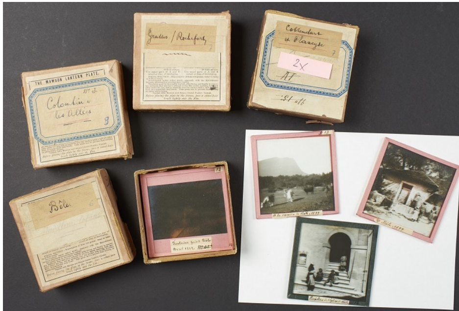
Exemple d'iconographie conservée dans des archives communales (photographies sur plaques de verre sur les villages de Auvernier, Bôle et Colombier, Commune de Milvignes)

Enfin, les archives communales conservent souvent des collections photographiques ou iconographiques, témoignages de l'histoire locale, et des fonds privés d'associations, de partis politiques ou de personnalités locales viennent parfois enrichir le patrimoine archivistique communal.