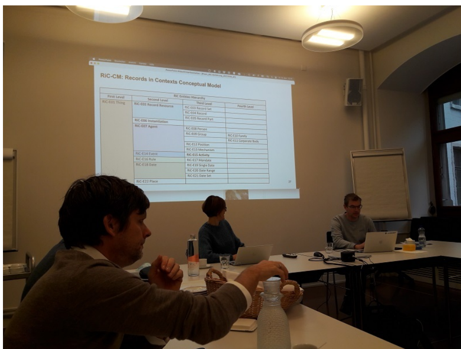
Le groupe de travail Archives communales lors d'un atelier d'échanges sur les Records in Contexts en novembre 2021

Les archives représentées sont aussi variées que la carte des communes de Suisse: la plus petite commune représentée dans le groupe de travail compte 3 505 habitants (1 698 ménages privés), la plus grande regroupe 420 217 personnes (204 411 ménages privés).