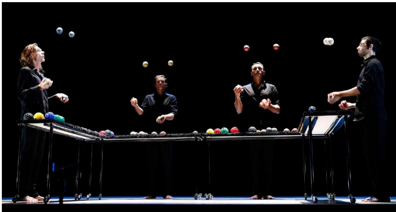
Le spectacle de jonglerie musicale Ballade à Quatre de la compagnie Le chant des balles

Autant de contraintes physiques particulièrement épineuses à appréhender. Expliquer pourquoi une figure est facile à jongler, ou non, n'est pas évident. Pire encore, cela varie d'un artiste à un autre. Comment rendre compte de cette complexité ? Cette question, encore en cours d'étude, trouvera peut-être sa réponse grâce à l'analyse vidéo. En filmant une personne en train de jongler, on comprendra peut-être mieux quelles figures elle est capable de produire. Et qui sait, un jour, on proposera à chaque artiste une manière de jouer une musique selon son propre style de jonglerie !