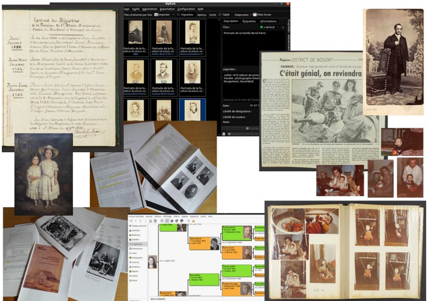
Des copies, des copies, toujours des copies (extraits de registres recopiés, photocopies de revues, tirages photographiques, coupure de presse, copies numériques d'archives conservées ailleurs, ...)