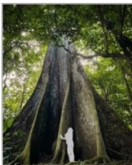
Fromager de Saül

L'usage de percussions comme mode de communication est attesté au sein de la communauté marrone dite de la montagne Plomb. Lors de procédures à l'encontre de noirs marrons, le tribunal s'enquiert du “ signal de reconnaissance que les marrons ont dans les bois ”. Il est répondu que “ lorsqu'ils font des tournées, ils conviennent de siffler avec un bois canon qu'ils ont dans la main ”.