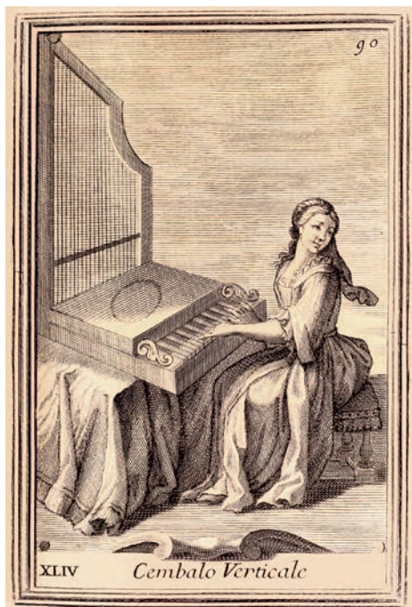
Imagen N°4. “Cembalo Verticale”. Grabado. Bonanni, Filippo. Gabinetto armonico pieno d'istromenti musicali . Roma, Giorgio Placho, 1722.

Posteriormente, Bédos de Celles también tomó en especial consideración los aspectos de comodidad y conveniencia en su descripción de instrumentos dedicados a un público amateur . Refiriéndose a los órganos de pequeño volumen, señalaba que éstos estaban destinados al salón o a la habitación, pero no eran apropiados para “conciertos” 56 ; el rango semántico de esta palabra en la segunda mitad del siglo XVIII abarcaba tanto a la práctica musical grupal, a espectáculos profesionales, como a salas diseñadas específicamente con el propósito de albergar funciones musicales 57 . En efecto, se trataba de objetos hechos a la medida para el ambiente doméstico: el énfasis en el poco volumen que ocupaban en una habitación da cuenta del nivel de penetración de