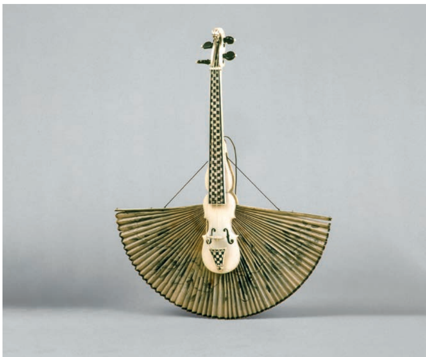
Imagen N°1. Violín-abanico. Anónimo. Francia, siglo XVIII. Largo: 290 mm. Coll. Musée de la Musique, París. INV.N° E.85.

* Este proyecto ha recibido financiamiento del programa de investigación e innovación de la Unión Europea, Horizon 2020, Marie Skłodowska-Curie grant agreement N°101029971. Agradezco a Jean-Philippe Echard el acceso a observar el "violín-abanico" en los depósitos del Musée de la Musique y la edición de la fotografía expuesta.