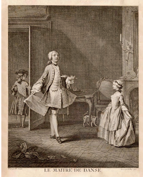
Imagen N°2. “Le maître de danse”: Jacques-Philippe Le Bas (grabador). Grabado sobre una imagen de Ph. Canot. París, J. P. Le Bas graveur du Cabinet du Roy, 1745. Bibliothèque Nationale de France.

donde instrumentos musicales, partituras e iconografía musical, se enlazaban con otros objetos ornamentales y curiosos en un mismo tejido social y material.