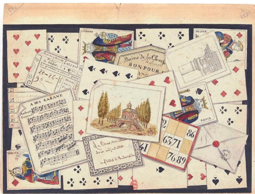
Imagen N°7. "Trompe l'oeil. Cartes à jouer, musique, loteries." Anónimo. Dibujo: acuarela y pluma. Dimensiones: 13 cm x 17,2 cm. Bibliothèque Nationale de France.

cartas de juego y elementos de lotería, referencias a viajes, un sobre cerrado y una partitura musical perfectamente legible. El texto de esta última reproduce un fragmento del cuento de Arnaud Berquin "La lira en la montaña", parte de su popular serie de cuentos publicados mensualmente en París entre 1782 y 1783, que relata el viaje de un músico hacia la recuperación de su cabaña en una aldea bucólica 99 . El juego, la literatura, la escritura de cartas, el viaje y la música, se conjugaban en un mismo tipo de persona -el dueño de la mesa o sus invitados- y un mismo tipo de ambiente: el ocio y la sociabilidad mundana de la Ilustración.