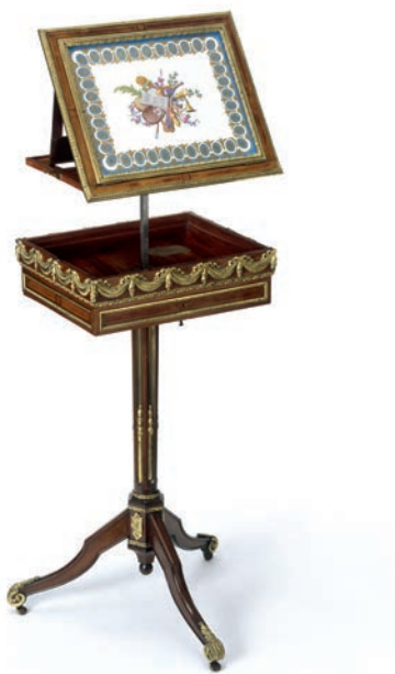
Imagen N°6. Atril-escritorio. Francia, ca. 1777-1785. Fabricado por Martin Carlin y Jean-Jacques Pafrat.