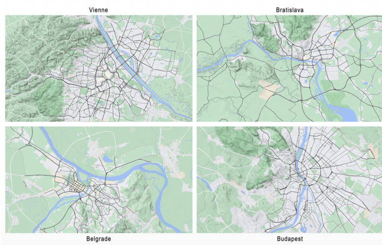
Figure 1. Script pour augmenter le contraste des rues sur une carte géographique sur le web

ressortir que la Hongrie reste le pays le plus dense si l'on tient compte de la superficie de chaque pays (93,025 km 2 de la Hongrie versus 357,588 km 2 de l'Allemagne). De même, on peut se concentrer sur les quatre capitales européennes sur le Danube : Vienne, Bratislava, Budapest et Belgrade. Si le développement urbain de chaque ville a connu une évolution dans le temps, leur image sous forme de carte géographique représente une empreinte historique de l'époque. Actuellement, il est commun d'accéder à un plan de ville en utilisant des services numériques comme OpenStreetMap ou Google Maps. Ces services proposent différents paramètres pour visualiser les éléments cartographiques : fonds, marqueurs, lignes, légendes, option d'interaction, entre autres. Malgré leur praticité, l'un des problèmes que pose ces cartes à une analyse visuelle du développement urbain est le réglage du contraste entre la représentation de rues et des fleuves. En effet, les deux objets d'intérêt sont affichés avec une valeur de tinte différente mais avec une valeur de saturation et luminosité similaire. Pour combler cet obstacle, nous revenons sur la technique de carte binaire de figure-fond pour l'analyse de configurations urbaines (Ratti 1999). À partir des cartes de ces quatre villes, nous avons développé un script pour le logiciel ImageJ qui permet de changer la couleur de courbes des rues, tout en gardant la tonalité bleue du Danube (figure 1).