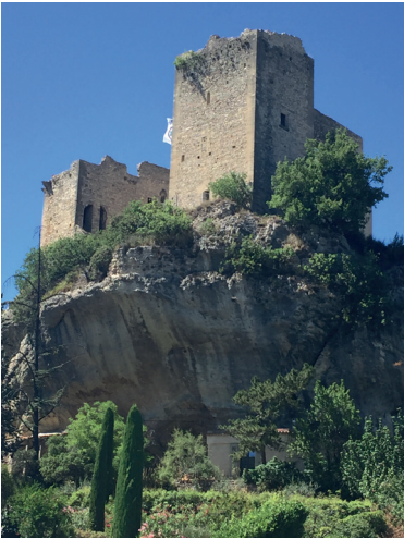
Vue du château