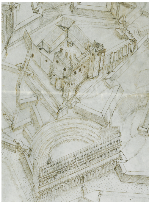
Vue cavalière du château d'Orange en 1603, au sein d'un projet de fortification élaboré et dessiné par J. Prat de Riez en Provence.

La Ville d'Orange s'est engagée dans l'ambitieux projet de mise en valeur du site de la colline Saint-Eutrope, dans ses composantes sociale, paysagère et, bien sûr, patrimoniale. Occupé depuis l'époque gauloise jusqu'à la fin de la période moderne, le site conserve en effet des vestiges de cette longue histoire : enceinte protohistorique, sanctuaire antique, habitations antiques tardives, église et castrum médiévaux, château moderne, pour ne mentionner que les éléments essentiels. Une première phase de travaux concernera en 2024 le château, dont il s'agira de rendre davantage lisible l'emprise et les structures bâties ayant résisté à la démolition ordonnée par Louis XIV à la fin du XVIIe s. Un diagnostic d'archéologie préventive et une étude archivistique, conduits en 2022 et 2023, éclairent d'un nouveau jour la compréhension de cet édifice, complétant les données recueillies au début des années 1990 par Ch. Markiewicz dans le cadre d'un vaste diagnostic portant sur l'ensemble du site.