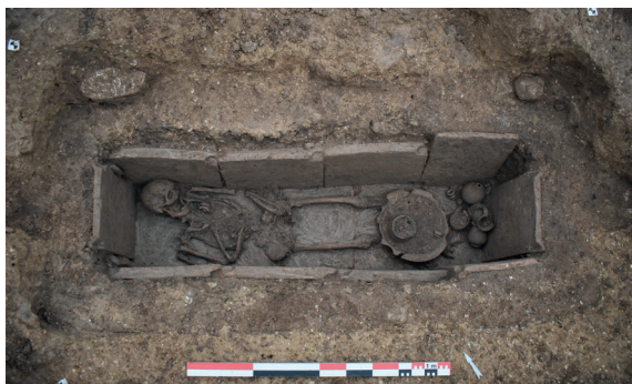
Vue zénithale du squelette et du mobilier d'accompagnement de la SP1847

majoritairement une orientation nord-ouest/sud-est et semble s'organiser autour d'un axe viaire orienté nord-est/sud-ouest. Au cours de la première moitié du I er s. ap. J.-C., une aire funéraire qui se compose de cinq dépôts secondaires de crémation se développe en bordure de voie. La nécropole est réoccupée à partir du IV e s. avec une quarantaine de sépultures à inhumation localisées à l'ouest de la voie. Les sépultures se caractérisent par une architecture funéraire variée ainsi que par la présence récurrente de mobilier d'accompagnement (fig. 1). Entre le V e s. et le VII e s., la nécropole se développe à l'est de l'axe viaire et est marquée par une évolution des pratiques funéraires. En effet, l'architecture funéraire adoptée au cours de cette phase d'occupation est majoritairement constituée de coffrages en tuiles disposées en bâtière, et, contrairement à la phase précédente, aucun mobilier d'accompagnement n'est présent.