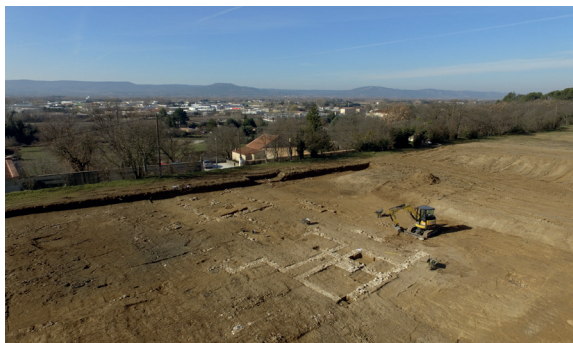
vue aérienne du site fouillé

En périphérie sud-est de la ville de Pertuis, une fouille conduite en 2019 a mis au jour les vestiges d'un établissement rural antique sur une superficie de 8000 m 2 , placé sur le rebord d'une terrasse dominant la vallée de la Durance.