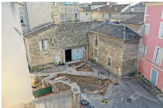
Vue de la fouille en cours de la synagogue moderne de L'Isle-sur-la-Sorgue © service communication ville de l'Isle-sur-la-Sorgue

Emilie PORCHER (Direction du Patrimoine de L'Isle-sur-la-Sorgue)