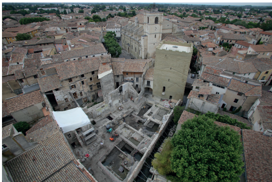
Vue d'ensemble de la fouille du site de la Tour d'Argent en 2022

conservation de certains bâtiments et orienté les architectes dans leurs projets de restauration. Ici, l'archéologie n'est pas perçue comme une contrainte mais telle une opportunité pour développer un projet qualitatif de restauration immobilière. Au-delà de cet aspect, les recherches sur ce site ont véritablement révélé l'histoire de L'Isle et alimenté notre réflexion sur la société médiévale avant l'arrivée des papes dans cette région du Comtat Venaissin. Nous verrons au travers d'un panel d'études archéologiques, développé depuis dix ans, des résultats significatifs concernant l'origine de la ville, la mise en place d'un véritable quartier aristocratique entre les XIIe et XIIIe siècles et enfin sa persistance jusqu'au XIXe siècle.