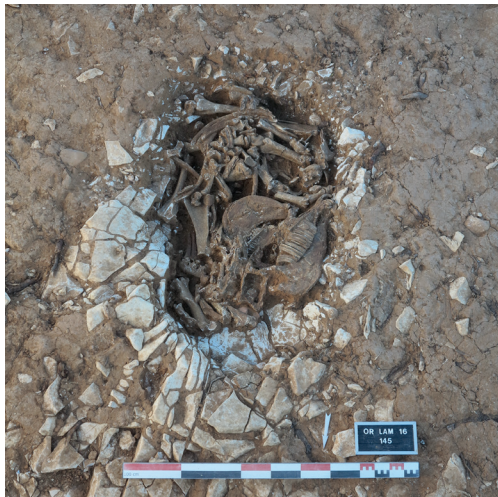
Fosse à équidés découverte sur la colline du Lampourdier à Orange

Loïc BUFFAT, Yahya ZAARAOUI (Mosaïque Archéologie)