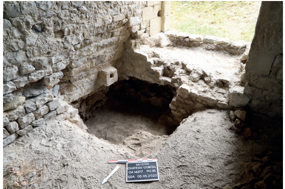
Négatif d'une cuve destinée à recueillir le jus de raisin aménagée dans le sol du cellier situé en rez-de-chaussée du château comtal de Vaison-la-Romaine

Durant l'époque médiévale, l'agglomération vaisonnaise a connu une évolution topographique importante en lien avec le conflit entre les évêques de Vaison et les comtes de Toulouse ayant motivé la construction du château par ces derniers au cours du dernier quart du XII e siècle. Perché sur la colline en rive sud de l'Ouvèze et entouré de son enceinte fortifié, cet élément symbolique de la période médiévale que constitue le château a fait l'objet d'un diagnostic d'archéologie préventive réalisé par le Service d'Archéologie du Département de Vaucluse en 2022 dans le cadre d'une étude d'évaluation en vue de sa mise en sécurité, sa restauration et sa valorisation. Celui-ci a offert l'opportunité d'une première relecture des élévations et des sources archivistiques apportant des informations précieuses sur la chronologie de construction et les aménagements successifs : plusieurs étapes successives ont ainsi pu être identifiées, s'échelonnant entre la fin du XII e siècle et le XIV e siècle. Les sondages effectués ont notamment permis de documenter un fouloir à raisin ainsi que l'indentification du cendrier d'un four à pain d'époque moderne.