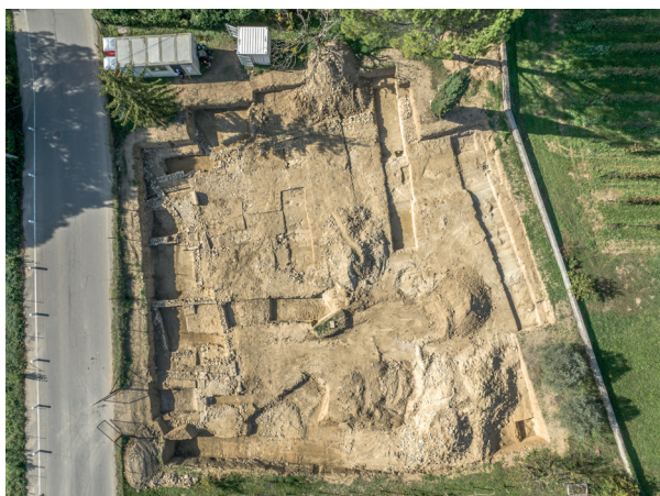
Vue d'ensemble du site de l'avenue Sautel avec, à gauche, les constructions de l'Antiquité tardive

Une fouille réalisée en 2022 aux environs des Thermes du Nord a permis de mieux cerner la limite nord de la ville antique qui se matérialise ici par le carrefour de deux voies, l'une venant de l'est et l'autre du nord, réaménagé à plusieurs reprises.