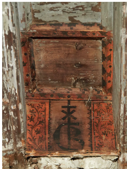
Découverte d'un closoir d'un plafond peint portant la signature d'un marchand

Cette étude de bâti, couplée à une étude archivistique, a permis de restituer l'évolution du bâti de deux hôtels particuliers situés dans le cœur économique de la cité des Papes depuis le XIII e siècle jusqu'à l'époque contemporaine. Etant donné le caractère exceptionnel des décors peints, une procédure de classement Monument Historique est en cours.