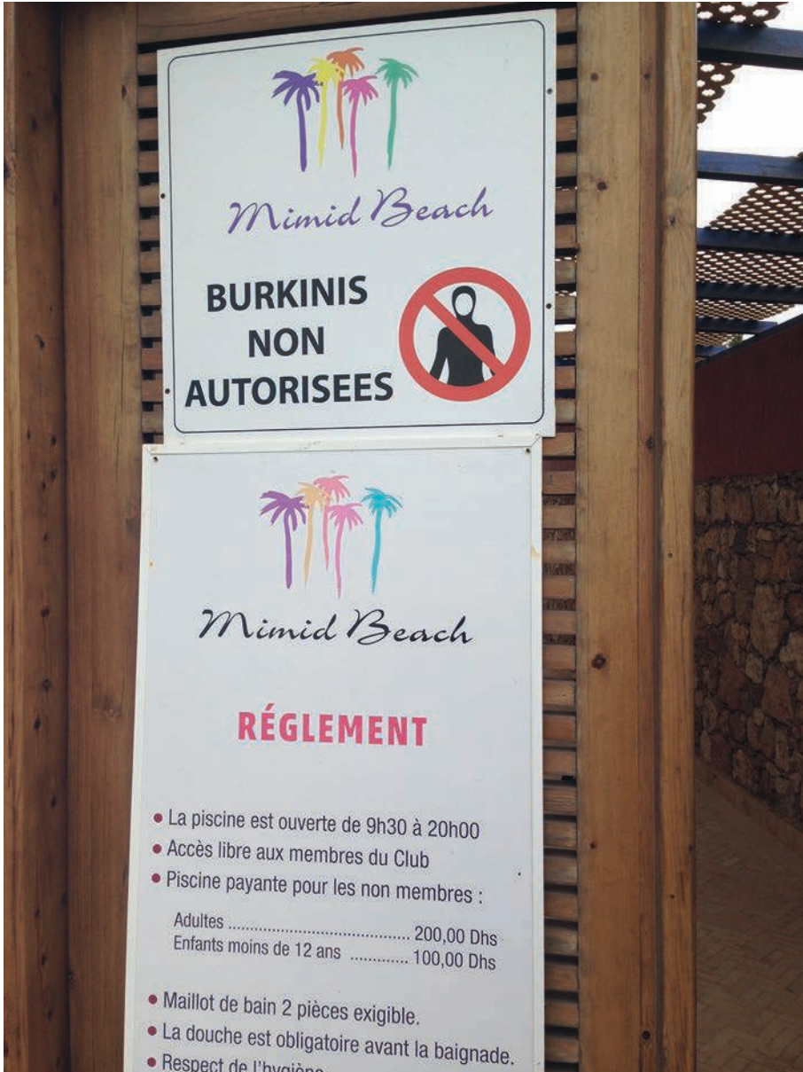
Photographie 8 : Règlement de la piscine d'une résidence fermée interdisant le port du burkini