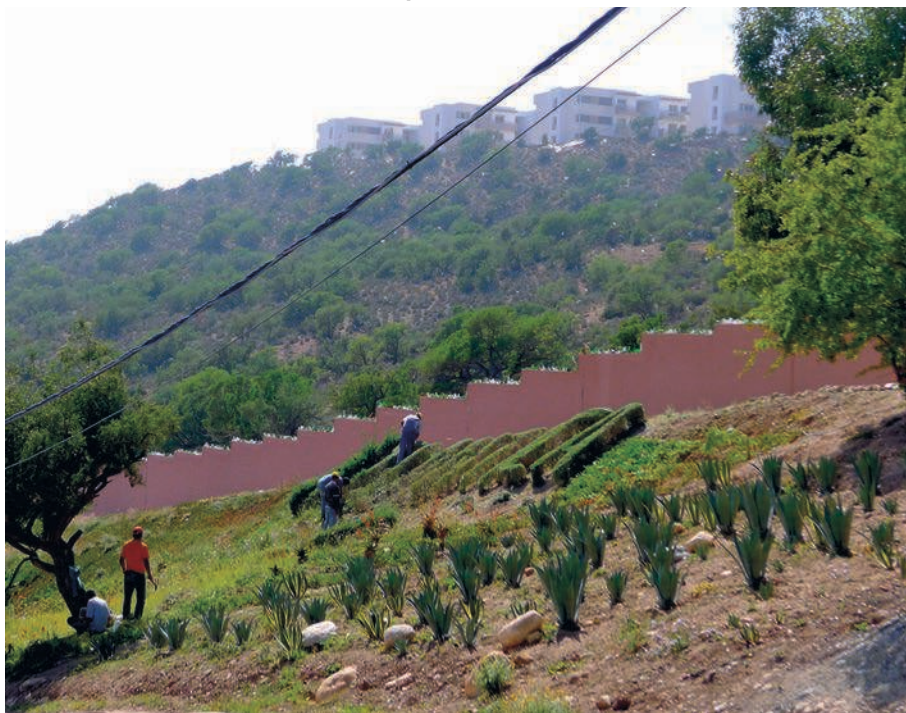
Photographie 5 : Mur dissuasif du camping Atlantica Parc donnant sur un quartier de logement social

Les campings, tels que le moderne Atlantica Parc à Imi Ouaddar, au nord d'Agadir, offrent aussi aux hivernant-e-s camping-caristes un contexte d'entre-soi protégé. Il repose sur la reproduction d'une urbanité exclusive délimitée par des murs d'enceinte, renforcés au nord par un dispositif dissuasif (cf. Photographie 5) du côté des quartiers de logement social situés sur le plateau. L'aménagement reprend de nombreuses caractéristiques d'un espace urbain avec ses rues, ses trottoirs, ses parterres fleuris et entretenus, ses équipements, comme le parc aquatique, et ses pôles de commerces et sociabilité (cf. Photographie 5 et 6). Les activités (gym, country, randonnée, loto, dictée) sont nombreuses et gérées exclusivement par les résident-e-s, revenant chaque année, souvent sur le même emplacement. Certaines activités renvoient directement à l'identité nationale, voire régionale, des habitant-e-s, comme la journée bretonne.