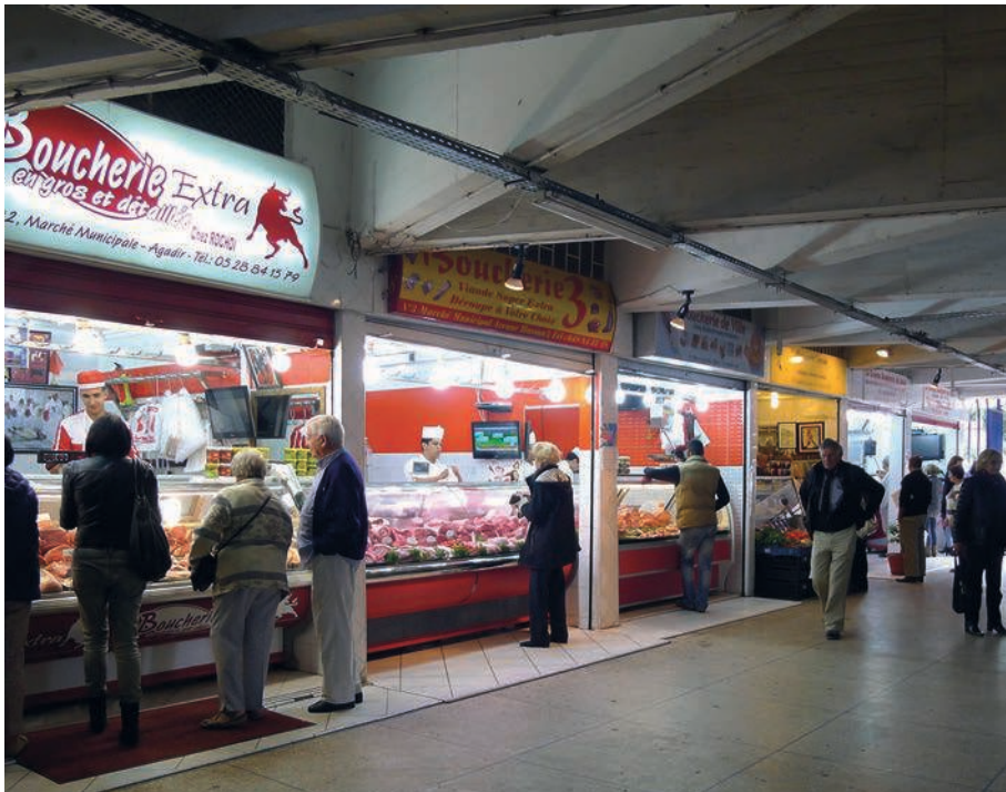
Photographie 9 : La fréquentation du marché municipal, un mode de consommation à l'européenne

Selon le plan communal de développement de la ville d'Agadir 2010/2016, la ville présente un problème d'isolement du secteur touristique par rapport à son centre-ville. L'analyse des pratiques des retraité-e-s français-es à Agadir montre au contraire comment ces migrant-e-s construisent un espace quotidien qui connecte différents quartiers centraux, ne se limitant pas à une appropriation touristique et accédant facilement à une diversité de ressources urbaines. Se remarque une grande tendance aux déplacements rituels quotidiens et hebdomadaires, liés aux activités de consommation, associées aux activités de loisirs ou de sociabilité. Les retraité-e-s combinent généralement la fréquentation de lieux de consommations modernes (supermarchés) et traditionnels (souks d'Agadir, d'Aourir ou d'Inezgane, plus populaire). Le marché municipal d'Agadir, situé dans le centre, concentre les pratiques d'achat du poisson, de la viande, des fleurs, et de la charcuterie, ce dernier stand s'adressant spécifiquement à la population européenne. Les retraité-e-s y retrouvent un mode de consommation traditionnel permettant une proximité avec les commerçant-e-s, dans un mode plus européen que le souk.