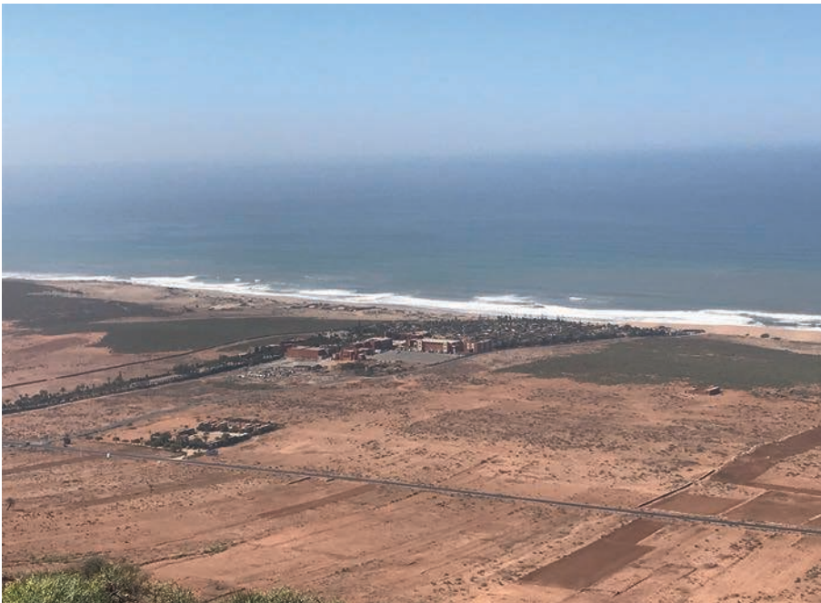
Photographie 1 : Vue aérienne de la résidence fermée Club Évasion, isolée à trente minutes en voiture de la ville la plus proche (Tiznit)