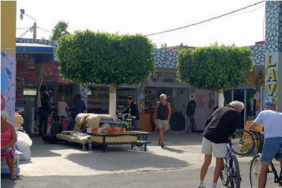
Photographie 7 : Place principale du camping Atlantica Parc