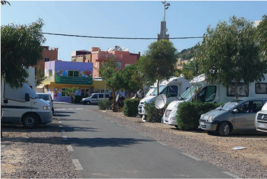
Photographie 6 : Des « rues » au bord desquelles s'organisent les emplacements