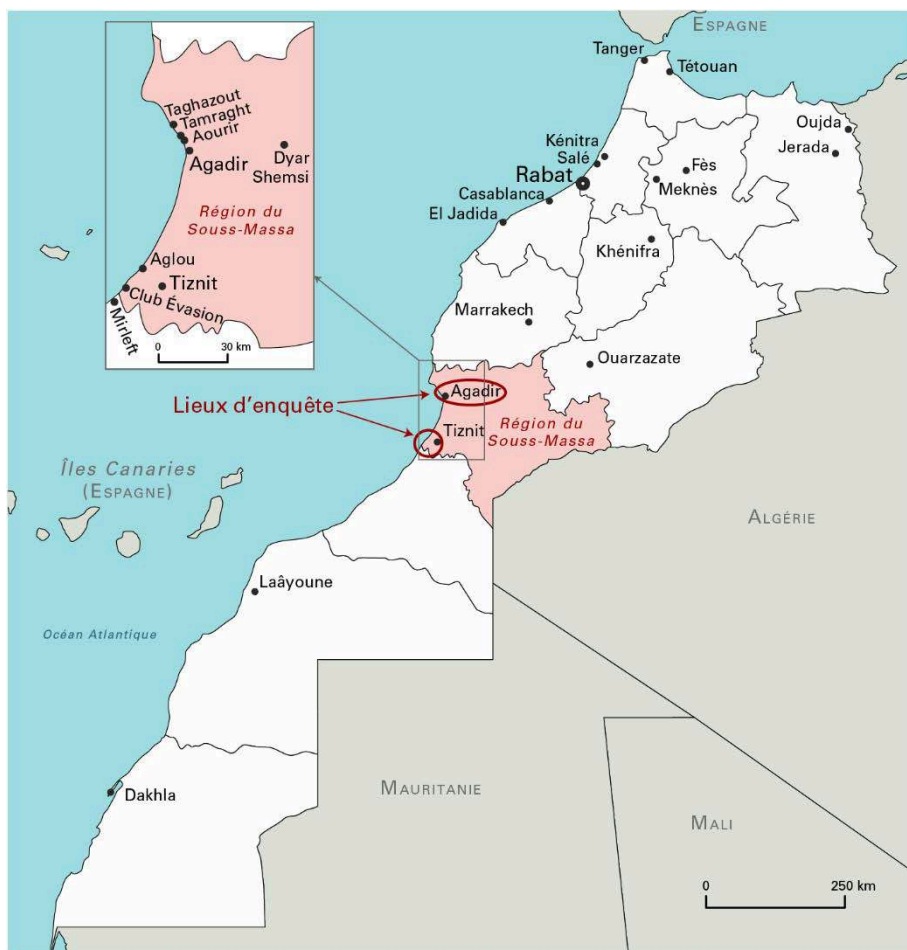
Carte 1 : Lieux des enquêtes au Maroc

Crédit : Fond de carte : dmaps.com ; Conception et réalisation : B. Le Bigot et J. Pinel, 2023 (d'après Pinel, 2020 : 103). Sources : Enquêtes de terrain, B. Le Bigot et J. Pinel, 2014-2019.