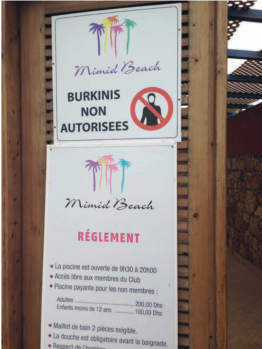
Photographie 8 : Règlement de la piscine d'une résidence fermée interdisant le port du burkini