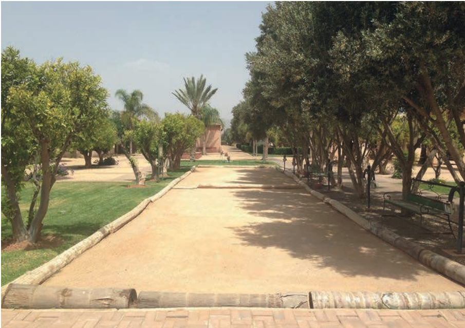
Photographie 4 : Terrain de pétanque de la partie commune de la résidence Dyar Shemsi