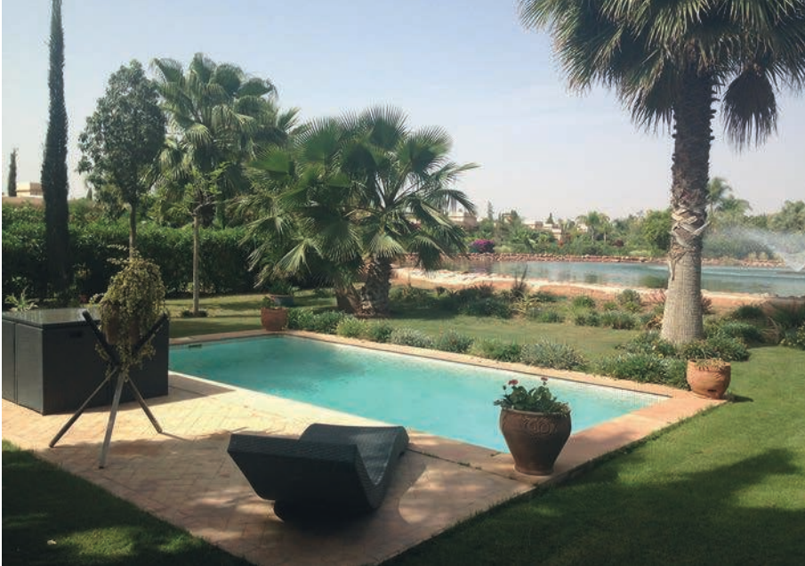
Photographie 3 : Jardin d'une propriété de la résidence Dyar Shemsi