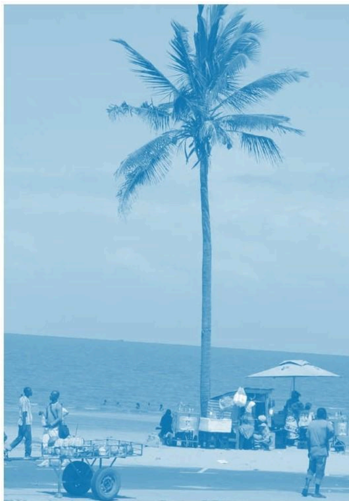
Cena de praia em Maputo (Moçambique). Espaço de trabalho para vendedores de comidas e bebidas, espaço de lazer para moradores, piscina e passeios aos domingos.