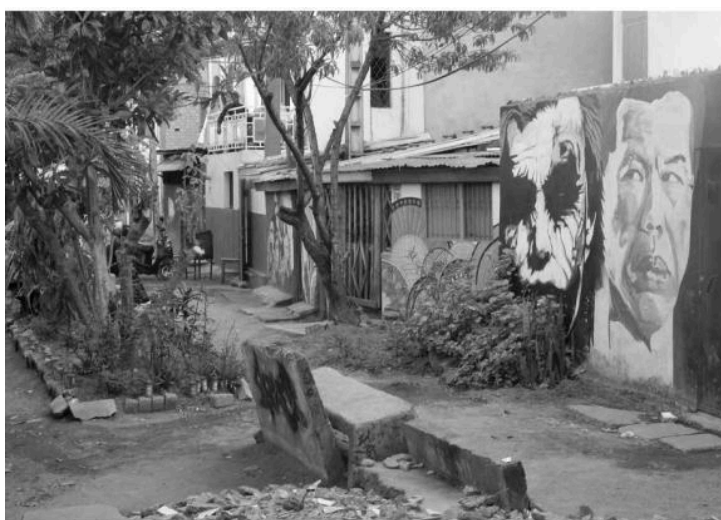
Afresco de Street Art feito em um bairro de Antananarivo (Madagascar). A emergência de uma geografia da arte no Sul.

Nessa perspectiva, desde a década de 1990, e ainda mais desde 2000, os trabalhos publicados em geografia desde a França mostram extrema diversificação. A consideração das temporalidades no estudo dos espaços se espalha para os países do Sul: Philippe Gervais-Lambony estuda as formas espaciais da nostalgia, enquanto Marie Bonte, em uma tese defendida em 2017, aborda uma Beirute noturna através de suas práticas festivas. Catherine Fournet-Guérin e Sandra Mallet propuseram uma geografia política dos tempos urbanos que se interessa por todos os espaços urbanos, do Norte ou do Sul, com ênfase nos ritmos dos cidadãos e das cidades ou nas práticas e representações da noite (Fournet-Guérin e Mallet, 2016; Oloukoï e Guinard, 2016). A curiosidade dos geógrafos agora os leva a práticas e representações do corpo no espaço (Brisson, 2015); a das mulheres e ao gênero (Marius, 2016). A consideração desta questão é flagrante: em qualquer tese agora, o autor dedica uma parte mais ou menos importante do estudo ao lugar das mulheres em particular, o que revela fenômenos ricos, aos quais os pesquisadores e pesquisadoras de gerações anteriores não teriam necessariamente prestado atenção.