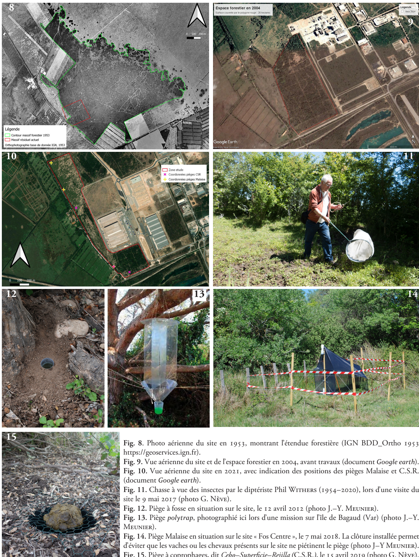
Fig. 8. Photo aérienne du site en 1953, montrant l'étendue forestière (IGN BDD_Ortho 1953 https://geoservices.ign.fr ). Fig. 9. Vue aérienne du site et de l'espace forestier en 2004, avant travaux (document Google earth). Fig. 10. Vue aérienne du site en 2021, avec indication des positions des pièges Malaise et C.S.R. (document Google earth). Fig. 11. Chasse à vue des insectes par le diptériste Phil WITHERS (1954–2020), lors d'une visite du site le 9 mai 2017 (photo G. NÈVE). Fig. 12. Piège à fosse en situation sur le site, le 12 avril 2012 (photo J.-Y. MEUNIER). Fig. 13. Piège polytrap, photographié ici lors d'une mission sur l'île de Bagaud (Var) (photo J.-Y. MEUNIER). Fig. 14. Piège Malaise en situation sur le site « Fos Centre », le 7 mai 2018. La clôture installée permet d'éviter que les vaches ou les chevaux présents sur le site ne piétinent le piège (photo J.-Y. MEUNIER). Fig. 15. Piège à coprophages, dit Cebo-Superficie-Rejilla (C.S.R.), le 15 avril 2019 (photo G. NÈVE).