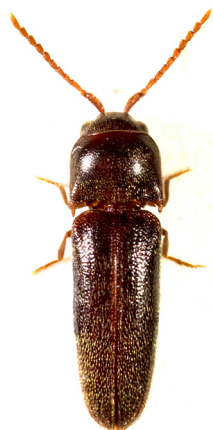
Fig. 17. Eucnemis capucina (Coleoptera, Eucnemidae), ici nouvellement signalé dans les Bouches-du-Rhône, capturé sur le site le 26 juin 2012.

À noter, parmi les coléoptères, la présence de Scyphophorus acupunctatus ( Dryophthoridae ), une espèce introduite se développant principalement sur les agaves, Agave sp., et secondairement sur Yucca sp., Dasytirion sp. et Beaucarnea sp. (TRONQUET, 2014), plantes également introduites en France, mais absentes du site d'étude.