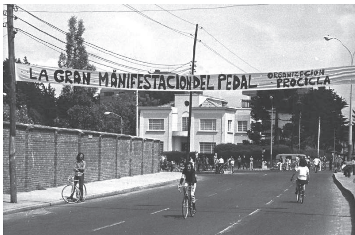
Figura 2. A grande Manifestação do Pedal, Bogotá, 15 de dezembro de 1974.

cidade, a Avenida 7 e a Avenida 11. Eles chamaram o evento “A Grande Manifestação do Pedal” e cerca de 5 mil pessoas participaram do ato.