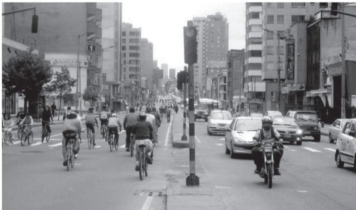
Figura 1. Ciclovía na Carrera Séptima, Bogotá.