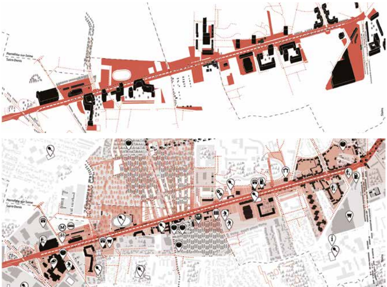
Fig. 5 - A. Brès, C. Hanappe, M.-A. Jambu, B. Mariolle, C. Mazzoni, D. Petrescu, C. Petcu e gli studenti del master e del dottorato del laboratorio UMR AUSser: carta della trasformazione della qualità delle strade regionali, realizzata nell'ambito del progetto intitolato Vision du territoire de la Seine Saint Denis à l'horizon 2030, 2020. © Bres/Mariolle-UMR 3329 AUSser.

A. Brès, C. Hanappe, M.-A. Jambu, B. Mariolle, C. Mazzoni, D. Petrescu, C. Petcu and the PhD students and researchers of the UMR AUSser, Intensifying the metropolitan area, Vision for the territory of Seine Saint Denis at the 2030 horizon, 2020. © Bres/Mariolle-UMR 3329 AUSser.