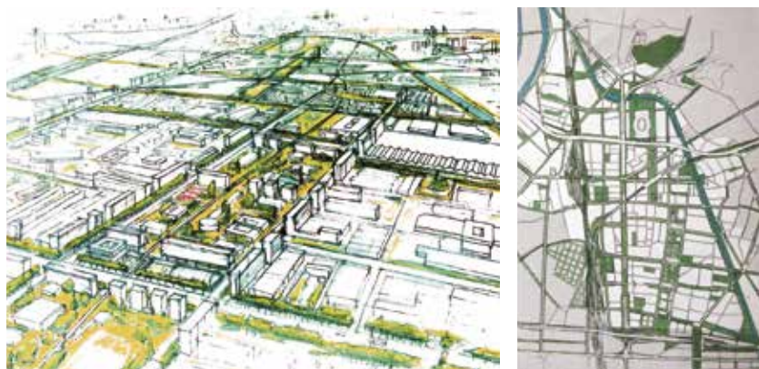
Fig. 4 - Studio Hippodamos, Trame verdi e blu come garanzia di urbanità nel progetto urbano della Plaine Saint Denis, 1990-2000.

Team Hippodamos, Green and blue frames as a guarantee of urbanity in the Plaine Saint Denis urban project, 1990-2000.