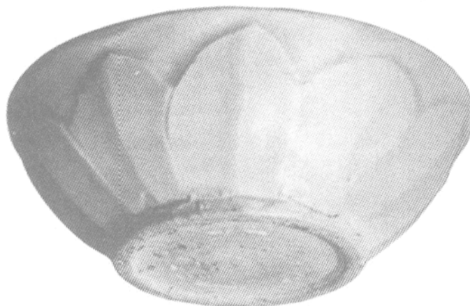
Figure 2. — Bol en porcelaine blanche de type qingbai