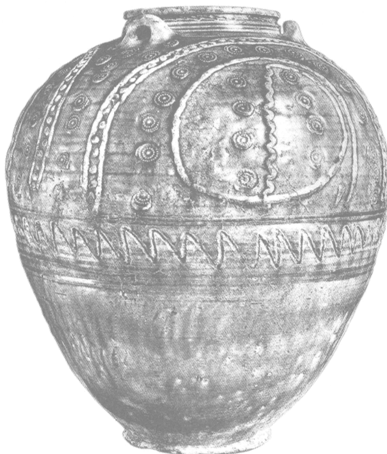
Figure 1. — Jarre à glaçure bleue de type « sassanido-islamique » découverte à Suse