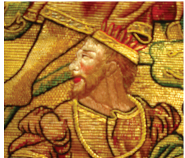
Fig. 1 : Nismes, " trésor " de l'église Saint-Lambert. Détail de la scène de la chasuble représentant un empereur romain (Tétricus I er ) coiffé d'une couronne radiée.

Nos commentaires porteront sur la chasuble, ornée d'une large bande brodée verticale, connue sous le nom de " Tige de Jessé ", montant jusqu'à un médaillon central célébrant la Vierge et l'Enfant. Cette image verticale de la généalogie divine illustre, entre autres, les rois de Juda et les autres ancêtres fantasmés du Christ. Comme l'avait déjà relevé P. Blondeau les autres ancêtres de Jésus ont des profils d'empereurs romains du IV e siècle, qu'on voit sur les pièces qui pullulent à fleur de terre sur les pentes de la Roche-à-Lomme... (Blondeau 1974 : 18).