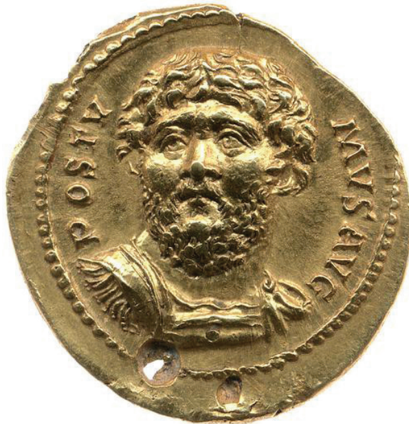
Fig. 6. Aureus de Postume au type INDVLG PIA POSTVMI AVG frappé à Cologne en 264, type Schulte 1983, 96a, trouvé avant 1833 (ou 1817 ?) à Jouy-aux-Arches (Moselle, F). British Museum : 6,69 g.

une des pièces faisant partie des célèbres Chasses de Maximilien offertes par Charles-Quint à François I er , dont le contrat fut signé le 12 février 1540 (Schneelbalg-Perelman 1982 : 106-107, fig. 65 et p. 277). Toutefois, l'image en question est moins typée, et il est difficile d'y reconnaître un empereur gaulois plutôt qu'un autre.