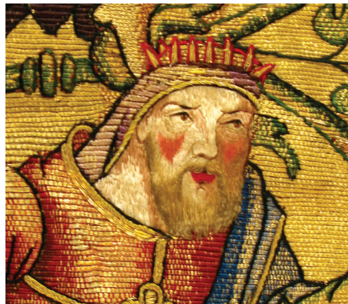
Fig. 4. Nismes, " trésor " de l'église Saint-Lambert. Détail de la scène représentant un empereur romain vu de face (Postume), voilé et coiffé d'une couronne radiée.

Un examen des innombrables portraits figurant sur les tapisseries bruxelloises de la 1 ère moitié du XVI e siècle nous montre la rareté de telles représentations. Nous avons cependant relevé une image du roi Modus, radié et tourné à droite, illustré sur la tapisserie du Mois de Février, dite L'Assemblée au Palais ,