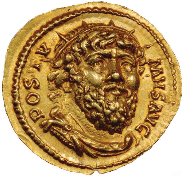
Fig. 5. Aureus de Postume au type HERCVLI THRACIO frappé à Cologne en 268, trouvé avant 1844, type Schulte 1983, 138a. Bibliothèque nationale de France, Cabinet des Médailles : 7,40 g.