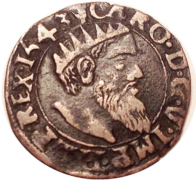
Fig. 3 : Courte de cuivre de Charles-Quint frappée à Anvers en 1543.

Un personnage en particulier avait retenu mon attention dès le milieu des années 1970, du fait de sa physionomie particulièrement expressive, mais plus encore par son image frontale. Certains détails – couronne radiée et angle de la " prise de vue " légèrement décalé vers la droite – permettent même une identification plus précise que la simple mention d'un " empereur romain de l'Antiquité tardive ". C'était du reste le sujet de la thèse annexe mentionnée plus haut. Mais, en réalité, ce seront deux de ces " empereurs romains " qui vont ici faire l'objet de quelques commentaires.