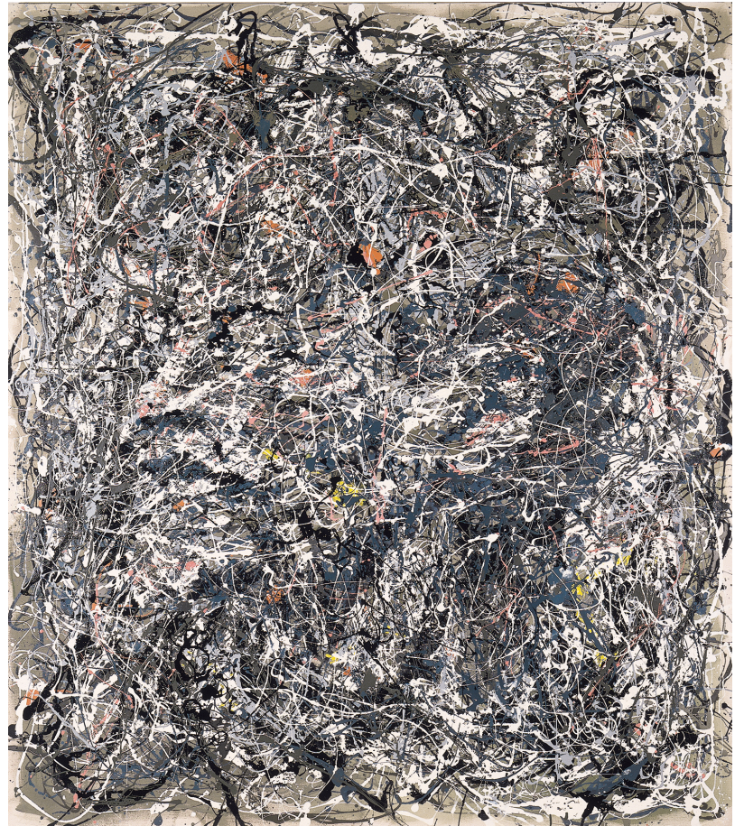
à droite Art & Language , "Map for Portrait of V.I. Lenin in the Style of Jackson Pollock V", 1979. Ink on paper, 20 x 20 cm, Herbert Foundation, Ghent. Reproduction avec l'aimable autorisation des artistes. à gauche Art & Language , "Portrait of V.I. Lenin in the Style of Jackson Pollock V", 1980. Enamel on canvas, 239 x 210 cm, Collection Mulier Mulier, Belgium. Reproduction avec l'aimable autorisation des artistes.