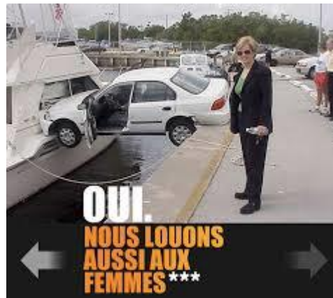
Figure 2. Quand SIXT utilise le stéréotype associé aux femmes pour leur louer des voitures. https://comongirl.wordpress.com/2015/02/17/sixt-oui-nous-louons-aussi-aux-femmes/

des femmes. Plusieurs études ont montré que les femmes sont considérées et se considèrent comme moins compétentes pour conduire que les hommes (Chateignier et al., 2011; Degraeve et al., 2015; Félonneau & Becker, 2011; Moè et al., 12).