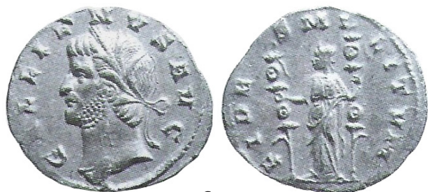
fig. 6 (éch. 2:1)

Aureus léger : COHEN 1 – COHEN 2 – ; VOETTER 1901-1902 – ; ALFÖLDI 1928 – ; ALFÖLDI 1931 – ; RIC V/1 – ; MIR 1333h.