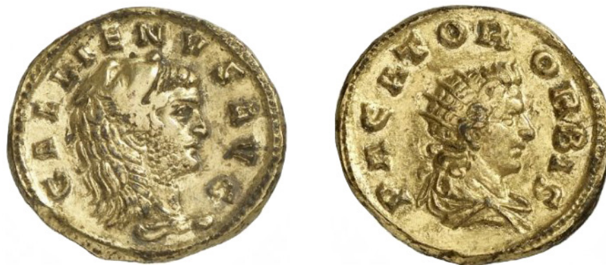
fig. 1 (éch. 2,5:1)

Aureus « lourd » : COHEN 1 155 (Wigan) ; COHEN 2 233 (B) ; VOETTER 1901-1902 - ; MENADIER 1914, n° 46 (Londres) ; ALFÖLDI 1931, p. 34, n° 6 (Stuttgart et Londres) ; RIC V/1, 447 ; DOYEN 1989, p. 385, type 5 ; MIR 1433g.