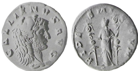
fig. 3 (éch. 2:1)

2B/2. Copenhague : données techniques inconnues = ALFÖLDI 1928, pl. 6, n° 3 = ALFÖLDI 1967, pl. 4, n° 3 = DOYEN 1989, p. 385, n° 5/3 ( fig. 4 ).