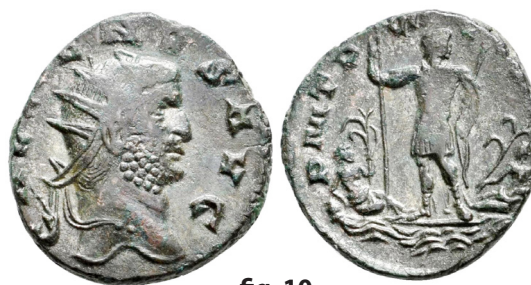
fig. 10 (éch. 2:1)

revers à la fois agressifs (MARTI PROP[V]G[N]ATORI), militaires (FIDES MIL ou FIDES MILITVM, FORTVNA REDVX) ou relevant de thématiques plus générales (AEQVITAS AVG, PAX AVG, PROVI AVG). Un type contemporain fort rare, daté PM TP ( sic !) VII COS PP 6 , dès lors postérieur au 1 er janvier 266, montre l'empereur en tenue de campagne, campant sur ses positions, entre deux dieux-fleuves identifiés comme la Save et la Kupa 7 . Siscia, rappelons-le, outre un important nœud routier, était un port fluvial implanté au confluent des deux rivières figurant sur quelques aurei 8 et sur des antoninien dont moins d'une dizaine nous sont parvenus (fig. 10) 9 .