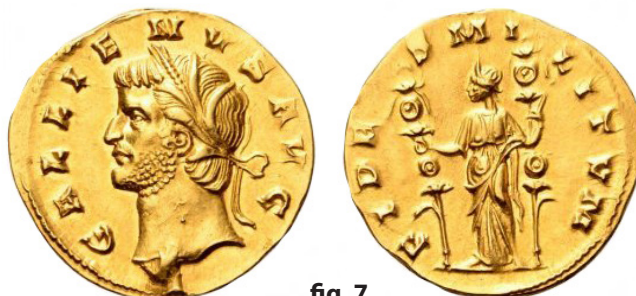
fig. 7 (éch. 2:1)

3/2. Roma Numismatics 27/8/2016, n° 582 = Roma Numismatics XIII, 23/3/2017, n° 889 : 3,66 g ; 1 = DOYEN 2020, p. 169, n° 46 (fig. 7).