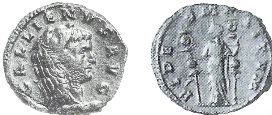
fig. 2 (éch. 2,5:1)

2B/1. Stuttgart : 5,915 g ; 6 ; 19 mm = ALFÖLDI 1931, pl. VI, n° 33 = DOYEN 1989, n° 5/2 = DOYEN 2020, p. 170, n° 47 ( fig. 3 ).