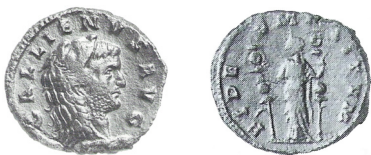
fig. 2 (éch. 1:1)