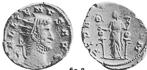
fig. 8 (éch. 2:1)

Antoninien : COHEN 1 – ; COHEN 2 – ; VOETTER 1901-1902, pl. 29, 66-68 ; ALFÖLDI 1931, n° 32 et pl. IV, n° 19 et 38 ; RIC V/1, 571 ; MIR 1433i.