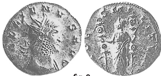
fig. 9 (éch. 2:1)

Antoninien : COHEN 1 – ; COHEN 2 238 (Rollin) ; VOETTER 1901-1902, pl. 29, 67-68 ; ALFÖLDI 1931, n° 33 ; RIC V/1, 571 ; MIR 1439ff.