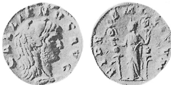
fig. 4 (éch. 2:1)

2B/1. Stuttgart : 5,915 g ; 6 ; 19 mm = ALFÖLDI 1931, pl. VI, n° 33 = DOYEN 1989, n° 5/2 = DOYEN 2020, p. 170, n° 47 ( fig. 3 ).