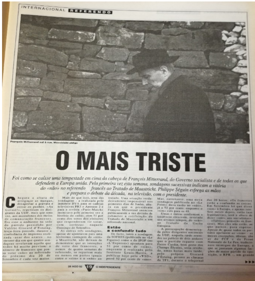
Doc 2 bis : « O Mais triste », O Independente, 20 août 1992, p. 20.