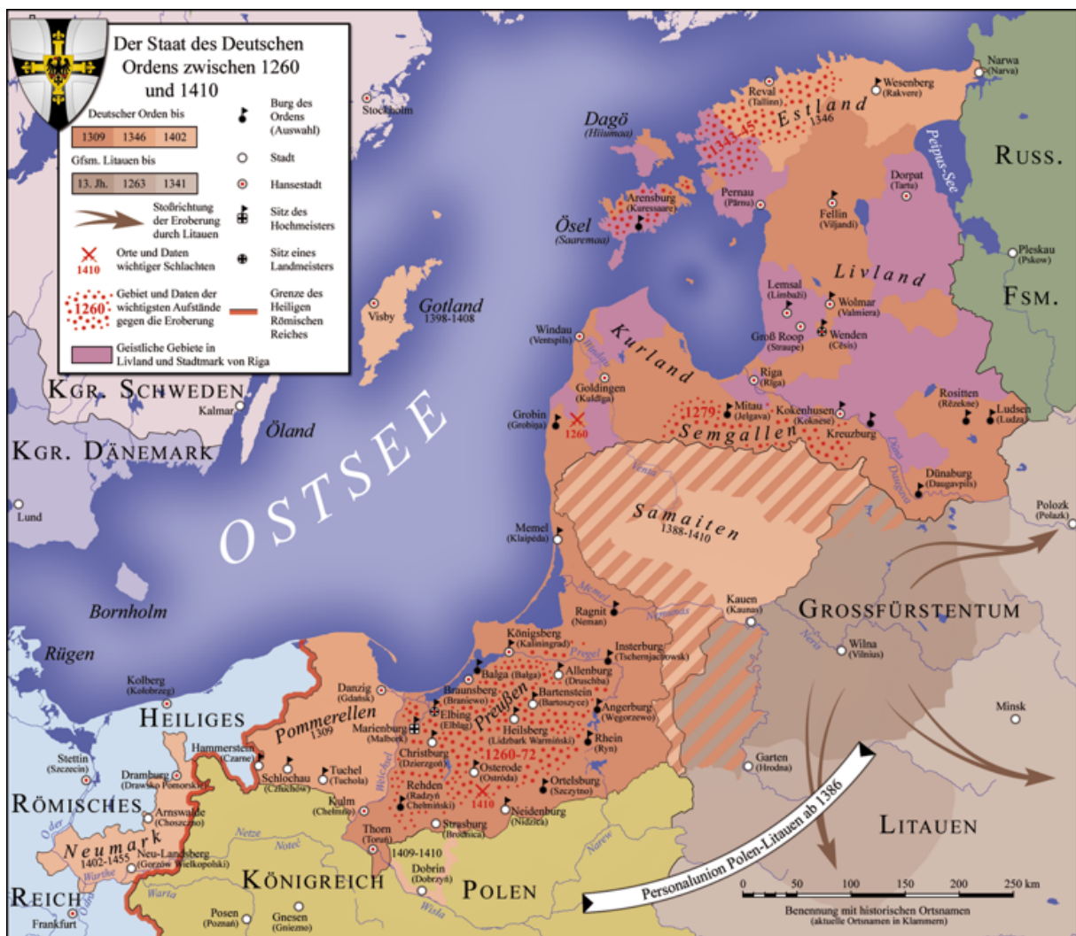
Bollmann S., Der Staat des Deutschen Ordens, 1260 bis 1410 , 2009. CC BY-SA 3.0 Wikimedia Commons

Für die Marienburg stand zu der Zeit Eichendorffs viel auf dem Spiel, weil sie erst nach Ende der Kriege gegen Napoleon wieder preußisch wurde und als architekturhistorisches Symbol für eine preußische Rache an Polen, insbesondere für die Niederlage bei Tannenberg, stand. Diesen Symbolcharakter wollte der König von Preußen Friedrich Wilhelm IV. hervorheben und bat deshalb Eichendorff darum, ein historisches und patriotisches Trauerspiel zu schreiben. 1815 hatten sich Eichendorff und sein Freund, der Minister Theodor von Schön, auf Befehl des Königs von Preußen Theodor Wilhelm III. dazu entschlossen, die Marienburg wiederaufzubauen, damit dieses Symbol der preußischen Macht in neuem Glanz erstrahlen konnte. Es ist wichtig zu erwähnen, dass Polen während der napoleonischen Herrschaft beinahe einen Konflikt zwischen Frankreich und Russland ausgelöst hätte, als Napoleon kurz