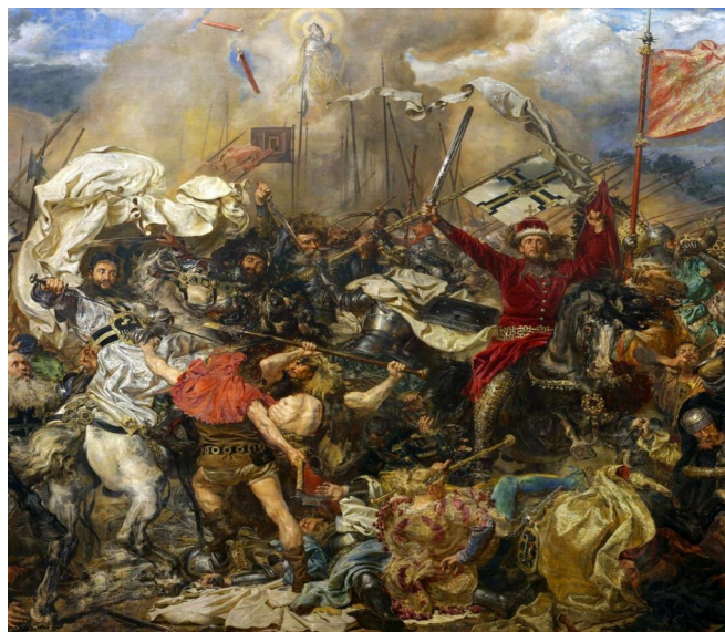
Jan Matejko, La Bataille de Grünwald , huile sur toile, 1878. Muzeum Narodowe, Varsovie.

La scène représente la mort du grand maître de l'ordre Teutonique, Ulrich von Jungingen. Au centre, le grand-duc de Lituanie, Vytautas.