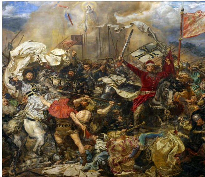
Jan Matejko, La Bataille de Grunwald , huile sur toile, 1878. Muzeum Narodowe, Varsovie.

La scène représente la mort du grand maître de l'ordre Teutonique, Ulrich von Jungingen. Au centre, le grand-duc de Lituanie, Vytautas.