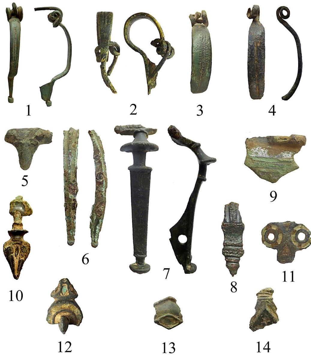
Fig. 3. Les fibules. Échelle 1/1.

10. Fibule à charnière entre deux plaquettes protégées par une plaque hémicirculaire, sans doute initialement sommée par un anneau dont ne subsiste que la base. L'arc à profil tendu, interrompu dans sa partie médiane par deux plaquettes transversales, se termine par un pied évoquant un fer de lance. Une dépression triangulaire longitudinale en occupe le centre. Rien n'indique qu'elle contenait de l'émail. Deux lignes de pointillés en forme de croix l'encadrent. Il ne subsiste que la trace du porte-ardillon allongé. Dim : 3,9 x 1,2 x 1,2 cm. Modèle peu courant. Fibule similaire à une autre provenant de Velzeke (DESCHIETER 2005, fig. 6, n° 6). CALLEWAERT 2017, type III.C.2* o : Quelques contextes datés ont fourni des fibules du type III.C.2. La production semble pouvoir être située dans les second et troisième quarts du