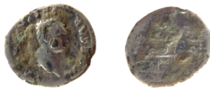
Fig. 2. La monnaie 17. Échelle 1/1.