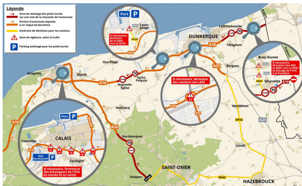
Figure 1. Le plan de gestion du trafic routier post- Brexit sur la côte d'Opale

La première difficulté posée à la ville de Calais est la gestion des flux de milliers de véhicules quittant ou rejoignant la France en ferry ou en navette Eurotunnel. Les flux sortants, c'est-à-dire rejoignant le littoral depuis l' hinterland (arrière-pays) européen, représentent un risque d'engorgement sur les routes calaisiennes. Un axe routier en particulier est susceptible d'être embouteillé : l'A16, qui concentre 70 % du trafic routier vers les ports maritimes des Hauts-de-France, relie la frontière franco-belge à Dunkerque et Calais. Son encombrement impacterait toute la façade maritime, y compris la mobilité quotidienne des résidents locaux, et toute l'économie régionale au-delà.