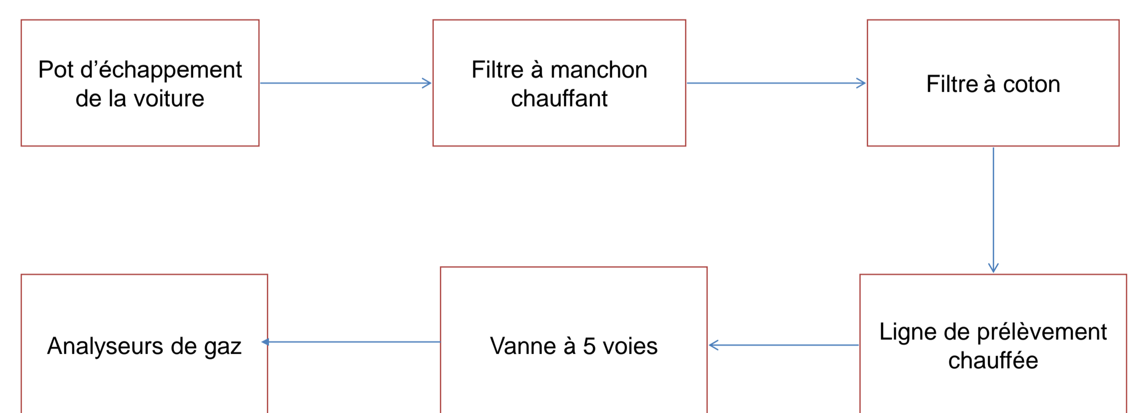
Schéma de prélèvement et d'analyse des gaz

Les émissions engendrées lors de l'utilisation des huiles végétales usagées comme carburant ou comme additif au diesel seront mesurées, sur un véhicule fourni par GECCO. Les gaz d'échappement seront échantillonnés grâce à une ligne de prélèvement chauffée munie de filtres, et analysés en ligne par différents analyseurs de gaz, ou par spectroscopie infrarouge à transformation de Fourier..., ou bien après prélèvement.