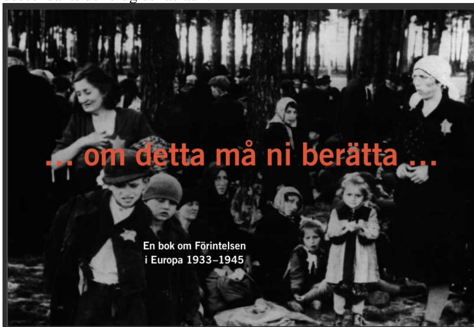
Illustration 2 : Stéphane Bruchfeld et Paul A. Levine, Om detta må ni berätta [Racontez-le à vos enfants], Stockholm, Natur & Kultur, 2013 [1998, 1 ère réédition revue 2009].

En imputant cet état de fait à la carence de l'éducation historique et à la propagande des groupuscules racistes dans les écoles, Persson en appelait à des mesures immédiates, dans la forme d'un projet de contre-information et de sensibilisation, pour pallier un déficit cognitif perçu comme un danger pour la conscience démocratique du pays. Pris au dépourvu, tous les leaders des partis d'opposition marquèrent leur adhésion au projet, qui leur fut exposé par la même occasion. La réponse préconisée consistait en la création d'une task force , sous l'autorité du Premier ministre, avec la tâche principale d'élaborer une publication destinée à la jeunesse. La mission fut confiée à deux jeunes chercheurs : Stéphane Bruchfeld et Paul A. Levine, respectivement doctorant suédois en histoire des idées et historien américain, tous deux affiliés à l'institut d'Uppsala à l'origine de l'étude citée par Persson. Le processus ainsi enclenché aboutit à la rédaction d'un livret de 84 pages. La date de sortie était fixée au 27 janvier 1998, jour de la libération du camp d'Auschwitz. Le titre – Racontez-le à vos enfants – n'est pas non plus sans importance : il s'agit d'une citation du livre des Prophètes, Joël 1:3 34 (illustration 2) qui inscrit cet opus dans la mystique juive. Les auteurs retenus sont, quant à eux, des descendants de réfugiés raciaux.