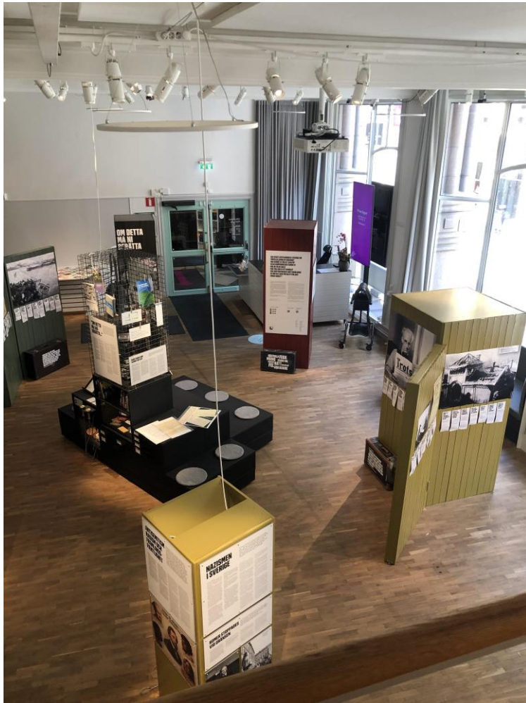
Illustration 3 : Forum för Levande historia – exposition permanente, section « La Suède et l'Holocauste ».