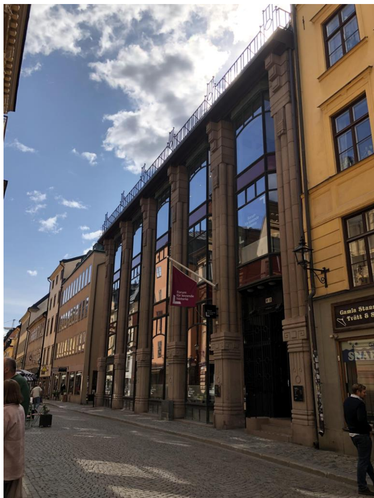
Illustration 1: Le siège du Forum för Levande historia à Stockholm, en 2021.

Les prodromes de cette agence publique, installée au cœur de la vieille ville de Stockholm (illustration 1), reposent sur un épisode précis : un « tournant » des termes du débat public sur la revisitation et l'usage de l'histoire, qui intervient à l'initiative du chef du gouvernement. Ce tournant installe la discussion sur la responsabilité de la nation face aux crimes contre l'humanité, la commémoration et le témoignage des victimes au cœur de l'agenda d'appareils institutionnels d'information sociale et de prévention de la violence, au sein desquels ces questions n'avaient eu guère, auparavant, droit de cité.