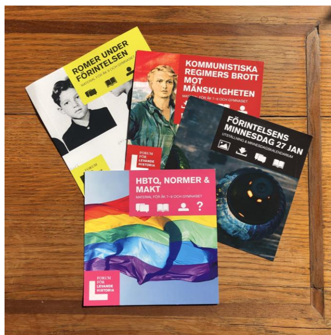
Illustration 4 : Exemple de brochures en libre accès au siège de FLH : calendrier de la Journée du souvenir et présentation de collections de ressources pédagogiques destinées aux écoles (minorités sexuelles, condition des roms, « crimes des régimes communistes »).

La présente analyse se referme sur une interrogation sur le bilan du FLH : une question incontournable, dès lors que le gouvernement suédois – à l'issue d'une enquête publique mandatée pour se prononcer sur son avenir – a pris la décision, le 30 septembre 2021, de transférer ses missions proprement liées à la transmission de la mémoire de la Shoah à un musée en voie d'aménagement à Stockholm 82 . La réponse devrait s'articuler en deux volets. Premièrement, sur le plan de la communication et de la fabrique du consensus à partir de la réflexion sur l'histoire, l'Agence peut se targuer, incontestablement, d'une « histoire de succès ». Dans sa production hétéroclite (rapports thématiques, ressources didactiques, expositions itinérantes...), des notions qui dans d'autres contextes paralysent le dialogue sur le rapport entre altérité, héritages et citoyenneté (« islamophobie », « antisémitisme », « homophobie » et « transphobie »...) se trouvent réunies, reconduites à une généalogie commune de l'exclusion, ce qui les rend facile à assimiler cognitivement, et à les dénoncer en bloc, les présentant dans un format « normalisé » et engageant (illustration 4).