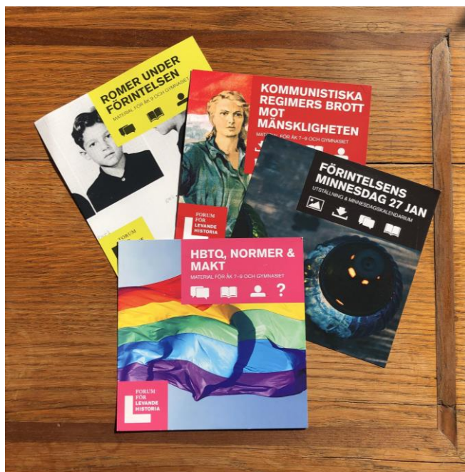
Illustration 4 : Exemple de brochures en libre accès au siège de FLH : calendrier de la Journée du souvenir et présentation de collections de ressources pédagogiques destinées aux écoles (minorités sexuelles, condition des roms, « crimes des régimes communistes »).

La présente analyse se referme sur une interrogation sur le bilan du FLH : une question incontournable, dès lors que le gouvernement suédois – à l'issue d'une enquête publique mandatée pour se prononcer sur son avenir – a pris la décision, le 30 septembre 2021, de transférer ses missions proprement liées à la transmission de la mémoire de la Shoah à un musée en voie d'aménagement à Stockholm 82 . La réponse devrait s'articuler en deux volets. Premièrement, sur le plan de la communication et de la fabrique du consensus à partir de la réflexion sur l'histoire, l'Agence peut se targuer, incontestablement, d'une « histoire de succès ». Dans sa production hétéroclite (rapports thématiques, ressources didactiques, expositions itinérantes...), des notions qui dans d'autres contextes paralysent le dialogue sur le rapport entre altérité, héritages et citoyenneté (« islamophobie », « antisémitisme », « homophobie » et « transphobie »...) se trouvent réunies, reconduites à une généalogie commune de l'exclusion, ce qui les rend facile à assimiler cognitivement, et à les dénoncer en bloc, les présentant dans un format « normalisé » et engageant (illustration 4).