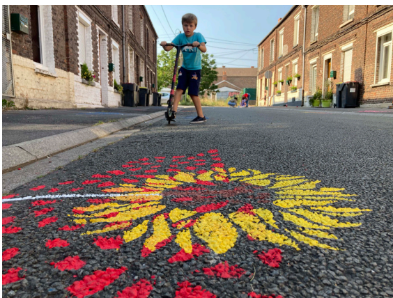
Figure 3 (droite). Les habitants tournent un film dans la permanence architecturale (Mélusine Pagnier)