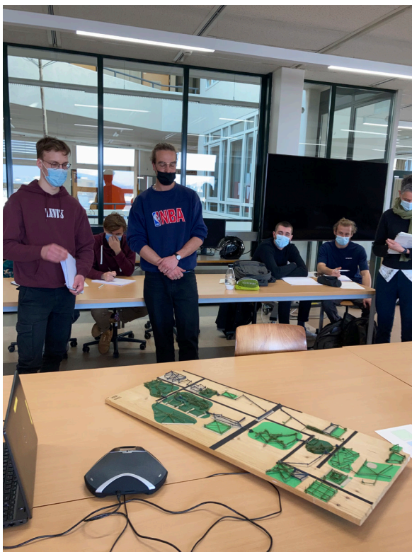
Figure 4 (droite, en bas). L'abondante production de maquettes des étudiant·es est très peu utilisée lors de la présentation du rendu de projet final (juin 2021)

Figure 3 (droite, en haut). Les étudiants utilisent peu la maquette pour présenter leur compréhension du territoire lors des rendus intermédiaires. Elle n'est mobilisée que sur demande de l'équipe pédagogique (avril 2021)