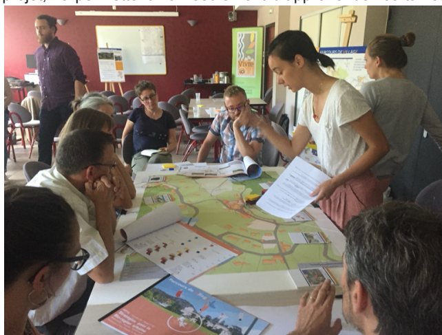
Figure 5. Mise en débat des projets avec les acteur-es du territoire, 2018

Ces trois propositions de projet ont en commun de révéler des ressources préexistantes, matérielles et immatérielles, souvent difficiles à percevoir, à travers des changements de regard sur le territoire et ses pratiques. Provoqués par les visualisations (Söderstrom, 2000b) et les imaginaires qui accompagnent un projet, ils permettent non seulement d'appréhender certaines ressources du territoire mais également d'engager le débat avec les acteur-es locaux, sur les conditions de leur mobilisation : peuvent-elles répondre, et à quelles conditions, à certains besoins du territoire ? Peuvent-elles, et si oui comment, être réappropriées par les habitant-es ? La démarche de projet permet non seulement d'identifier et de rendre visible un horizon souhaitable, mais surtout d'en tester certaines conditions de mise en œuvre. C'est dans ce sens que la projection dans un à-venir envisageable et potentiellement tangible proposée par le projet offre un outil de pensée et de mise en débat (fig. 5) des futurs possibles pour les territoires (Söderstrom, 2000a), modifiant, par rétroaction, la connaissance et la compréhension du déjà-là.