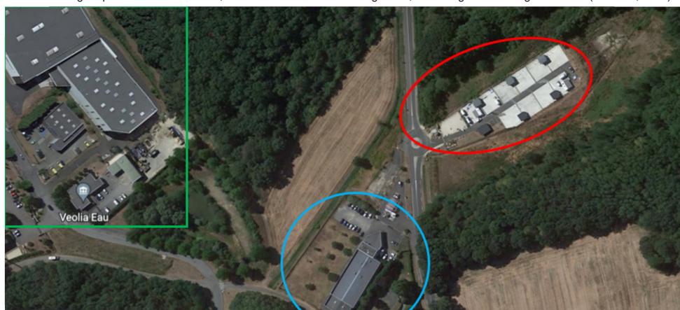
Figure 3. Situation de l'aire d'accueil de Dourdan. L'ovale rouge représente l'aire d'accueil, le rond bleu la station de lavage auto, le rectangle vert le siège de Veolia (Lecomte, 2022)

Dourdan, seconde commune investiguée, est un lieu de passage au moment des foires. Une aire d'accueil prévoyant le séjour des familles de « voyageurs » jusqu'à trois mois se situe en périphérie de la ville. Le mode d'habiter des « voyageurs » dans la ville contemporaine est en effet marqué par la ségrégation, la limitation du capital circulatoire et des stratégies d'adaptation aux rétractions des possibilités de circuler ou s'installer (Loiseau & Granal, 2022).