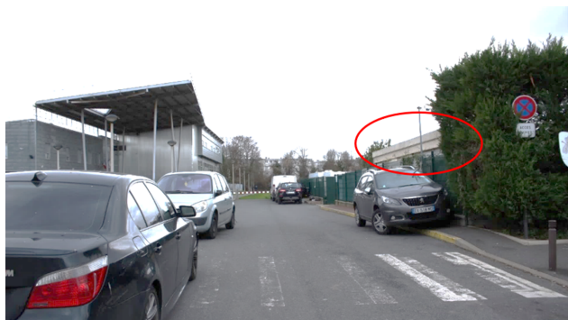
Figures 1 & 2. Situation du lycée professionnel de Morsang-sur-Orge (entourés : le toit de l'extension d'une caravane sur la figure 2, délimitation du terrain désigné) (Lecomte, 2020)

La localisation des terrains désignés 1 et les pratiques spatiales des « voyageurs » sont une illustration des processus de relégation à l'œuvre dans la ville. Le premier terrain investi pour la recherche, le lycée professionnel de Morsang-sur-Orge, se situe au nord du département de l'Essonne dans un quartier populaire. Un terrain assigné aux « voyageurs de la commune » est en face du lycée et jouxte le cimetière.