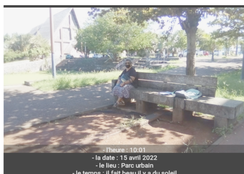
Figures 2 & 3. Extraits de récits multimédias du parc urbain par un élève ( Com-Phone Story Maker )

Transcription du vocal de l'élève sur la diapo 1 : « On voit des personnes, heu ... des bancs, des arbres, des feuilles sont vertes, les bancs sont en pierre, ils sont gris. Les personnes marchent, qui s'assoient, des personnes âgées ou des personnes jeunes. Le vent c'est fort ! On voit des personnes avec leur chien, des voitures. »