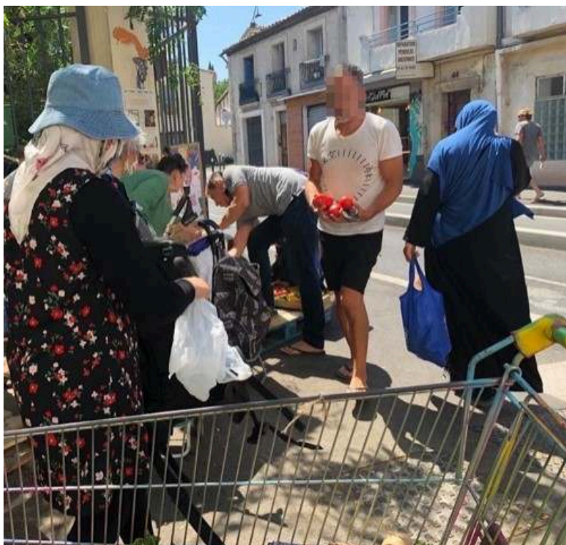
Image 2. Récupération alimentaire au square du Père Bonnet, quartier Figuerolles, par des hommes comme des femmes, aux origines socio-ethniques diversifiées.