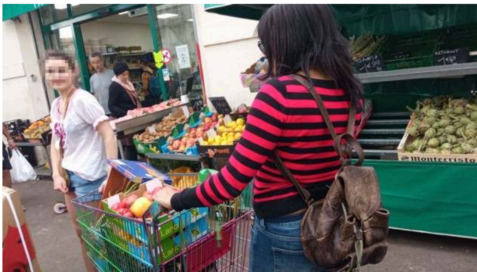
Image 1. Collecte par des membres de l'AJAP d'aliments invendus dans les petits commerces de Figuerolles