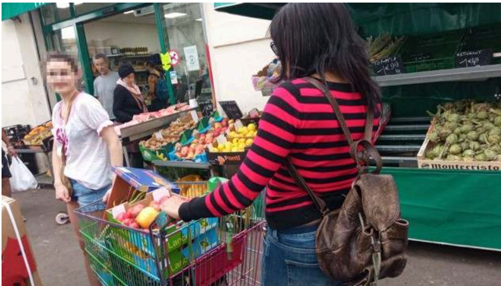
Image 1. Collecte par des membres de l'AJAP d'aliments invendus dans les petits commerces de Figuerolles